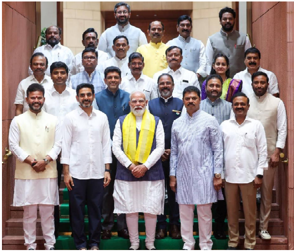
కాకినాడ, (రాజధాని వార్తలు): ఆంధ్రప్రదేశ్ రాష్ట్ర రాజధానిగా అమరావతికి చట్టబద్ధత కల్పించే బిల్లును పార్లమెంటు ఆమోదించడం సంతోషంగా ఉందని, పెద్దన్నలా అండగా ఉండి సహకరించిన