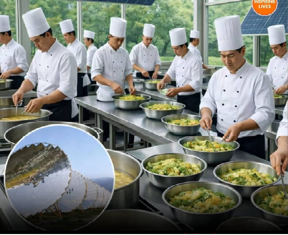
అవుతుంది-పర్యావరణ స్థిరత్వానికి పెద్ద విజయం.

(రాజధాని వార్తలు): రాజస్థాన్లోని ఆరావళి కొండల్లో ప్రశాంతంగా ఉన్న శాంతివన్-బ్రహ్మ కుమారిస్ ఆధ్యాత్మిక ప్రధాన కేంద్రం- ప్రపంచంలోనే అతిపెద్ద సౌరశక్తితో నడిచే వంటశాలను నిర్వహిస్తూ అంతర్జాతీయ గుర్తింపు పొందింది. ఇక్కడ రోజుకు 50,000 శాఖాహార భోజనాలు సిద్ధం చేయగల సామర్థ్యం ఉంది; నివాసితులు, వాలంటీర్లు, వేలాది సందర్శకులకు వడ్డిస్తారు. టెక్నాలజీ: 84 భారీ పారాబోలిక్ రిఫ్లెక్టర్లు సూర్యుని కదలికను ఆటోమేటిక్ గా ట్రాక్ చేస్తాయి. అవి సూర్యరశ్మిని కేంద్రీకరించి నీటిని మరిగించి రోజుకు 3,500 కిలోలకు పైగా హై-ప్రెజర్ స్టీమ్ ఉత్పత్తి చేస్తాయి. ఈ ఆవిరిని ఇన్సులేటెడ్ పైపుల ద్వారా నేరుగా భారీ వంట పాత్రలకు పంపిస్తారు. ప్రభావం: సాధారణ పరిస్థితుల్లో ఎల్ఐజి/డిజిల్ వంటి సాంప్రదాయ ఇంధనాలు అవసరం లేకుండా వంటశాల పని చేస్తుంది. దీని వల్ల ఏటా సుమారు 2,00,000 కిలోల వంట గ్యాస్ ఆదా