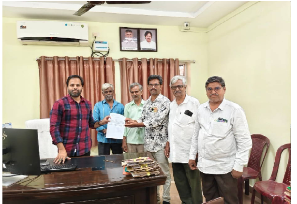
పెద్దాపురం, (రాజధాని వార్తలు): పెద్దాపురం పురపాలక సంఘంలో