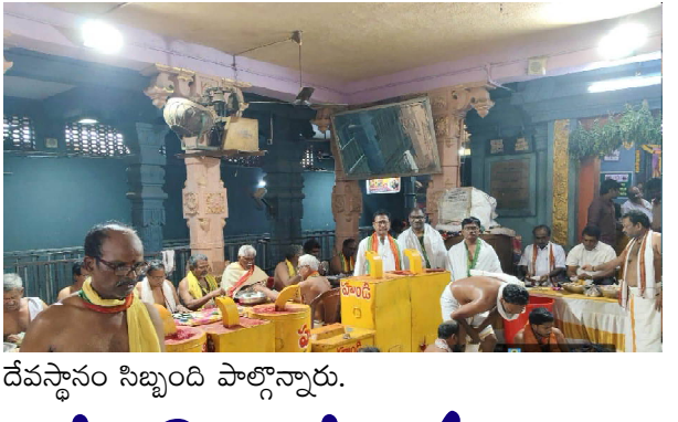
దేవస్థానం సిబ్బంది పాల్గొన్నారు.