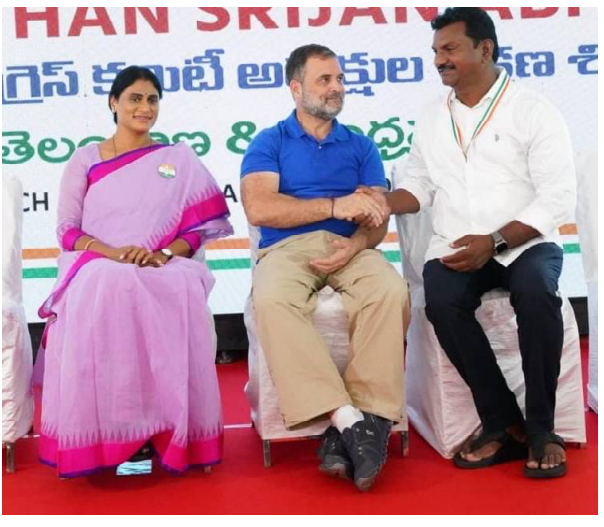
రోజుల పాటు కొనసాగిన ఈ శిక్షణా శిబిరంలో పార్టీ సంస్థాగత బలోపేతం, నాయకత్వ సామర్థ్యాల అభివృద్ధి, ప్రజలతో అనుసంధానం, ఎన్నికల వ్యూహారచన వంటి అంశాలపై సమగ్ర చర్చలు