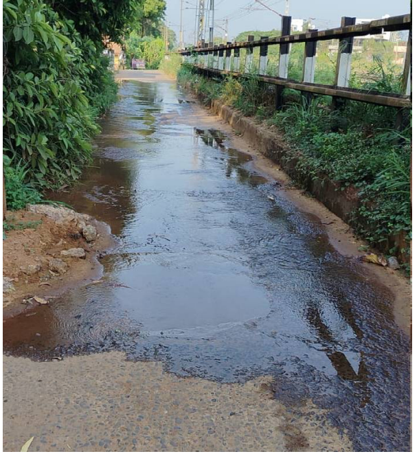
అనపర్తి, (రాజధాని వార్తలు): ఉష్ణోగ్రతలు ఎక్కువవుతున్న తరుణంలో ప్రజలకు త్రాగునీరు ఎంతో అవసరం. ప్రజలకు

త్రాగునీరు అందించే బాధ్యత సంబంధిత అధికారులపై ఉంది. కానీ అనపర్తి రైల్వే గేటు సమీపంలోని షారోన్ వరం కాలువలో అధికారులు నిర్లక్ష్యం కారణంగా త్రాగునీరు వృధాగా పోతుంది. అనేక ప్రాంతాల్లో త్రాగునీటికి ప్రజలు అనేక ఇబ్బందులు ఎదుర్కొంటుంటే, ఇక్కడ త్రాగునీటిని వృధా చేయడంపై అధికారులపై ప్రజలు అసహనం వ్యక్తం చేస్తున్నారు. కాలువకి ఆసుకుని ఉన్న సిమెంట్ రోడ్డులో ఇటీవల త్రాగునీటి పైపైలైన్ మరమ్మత్తులు చేపట్టినప్పటికీ, వనరులు నక్రమంగా చేయకపోవడంతో పైపైలైన్ నుంచి నీరు లీక్ అవుతూ త్రాగునీరు వృధాగా పోతుంది. ఈ లీకేజీ కారణంగా రోడ్డుతా మంచినీటితో నిండిపోయింది. ఆ మార్గం గుండా ప్రయాణించే ద్వీచక్ర వాహనదారులు, బాటసారులు జారిపడే ప్రమాదానికి గురవుతున్నారు. ముఖ్యంగా రాత్రి సమయంలో పరిస్థితి మరింత ప్రమాదకరంగా మారుతుందని స్థానికులు ఆవేదన వ్యక్తం చేస్తున్నారు. ఇక పంచాయితీ నీరు వృధా అవుతున్నప్పటికీ సంబంధిత అధికారులు పట్టించుకోకపోవడం ప్రజల్లో ఆగ్రహానికి దారితీస్తోంది. వెంటనే లీకేజీని సరిచేసి, రోడ్డును మరమ్మత్తు చేయాలని స్థానికులు డిమాండ్ చేస్తున్నారు. ఈ సమస్యకు పరిష్కారం ఎప్పుడు వస్తుందో అని ప్రజలు ఎదురు చూస్తున్నారు.