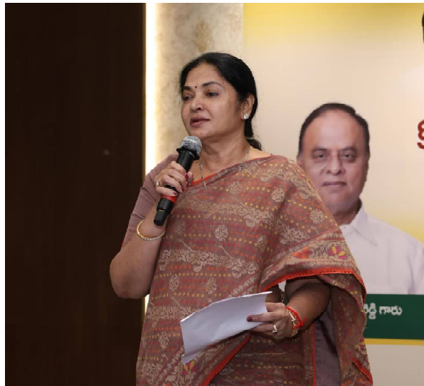
మెరుగుపూతయి ఆమె ఆకాంక్షించారు.