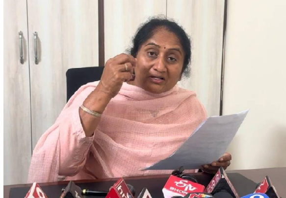
చేనేత, జొళి రంగానికి ఎంతో మేలు

పెనుకొండ/శ్రీ సత్యసాయి, (రాజధాని వార్తలు): కేంద్ర ప్రభుత్వ బడ్జెట్లో ఏపీకి ప్రాధాన్యమైనా నిధులు కేటాయింపు క్రెడిట్ అంతా సీఎం చంద్రబాబుదేనని రాష్ట్ర బీసీ, ఈడబ్ల్యుఎస్ సంక్షేమ, చేనేత మరియు జొళి శాఖ మంత్రి ఎస్.సవిత స్పష్టం చేశారు. బడ్జెట్లో ఏపీకి ప్రాధాన్యంపై తరుచూ ఢిల్లీ వెళ్లి పీఎం నరేంద్ర మోడీని, ఇతర కేంద్ర మంత్రులకు కలిసి రాష్ట్రానికి నిధులు రాబట్టారన్నారు. కేంద్ర ఆర్థిక మంత్రి నిర్మలా సీతారామన్ ప్రవేశ పెట్టిన బడ్జెట్ అన్ని వర్గాల వారికీ అనుకూలమైనదని కొనియాడారు. ముఖ్యంగా ఉద్యోగులకు ఆదాయ పన్ను శాతం స్లాబ్ రేటు పెంపుదల ఎంతో మేలు కలుగుతోందన్నారు. పెనుకొండ లోని క్యాంపు కార్యాలయంలో సోమవారం నిర్వహించిన విలేకరుల సమావేశంలో మంత్రి సవిత మాట్లాడారు. కేంద్ర ఆర్థిక శాఖ మంత్రి నిర్మలా సీతారామన్ తొమ్మిదో పర్యాయం బడ్జెట్ ప్రవేశపెట్టడం అభినందనీయమన్నారు. బడ్జెట్లో బాలికా విద్యకు, వ్యవసాయానికి, చేనేత, జొళి రంగానికి అధిక ప్రాధాన్యత ఇచ్చారన్నారు. ప్రతి జిల్లాలోనూ బాలికా హాస్టల్ ఏర్పాటు చేయడానికి కేంద్రం నిర్ణయించడంపై మంత్రి హర్షం వ్యక్తంచేశారు. ఈ హోల్లో ఏర్పాటుతో బాలికా విద్యార్థిత్వ డిగ్రీ ఎంతో మేలు కలుగుతుందన్నారు. రూ. 12 లక్షల వరకూ ఆదాయ పన్ను మినహాయింపు, స్టాండ్బీ డిడిక్షన్ రూ. 75 వేల వరకూ పెంపుదలతో ఉద్యోగులకు ఎంతో మేలు కలుగుతుందన్నారు. షీ మార్ట్ల ఉద్యోగికి సైతం రూ. 60 వేల నుంచి రూ.లక్ష వరకూ లబ్ధి పొందుతుందన్నారు. గ్రామీణ మహిళల సాధికారతతో పాటు స్థానిక ఉత్పత్తులకు డిమాండ్ కలిగేలా మండల స్థాయిలో షీ మార్ట్లను కేంద్ర ప్రభుత్వం ఏర్పాటు చేయాలని నిర్ణయించిందన్నారు. షీ మార్ట్ల వల్ల గ్రామీణ మహిళలకు ఉపాధి కల్పనతో ఆర్థిక భరోసా కలుగుతుందని మంత్రి సవిత అనందం వ్యక్తంచేశారు.