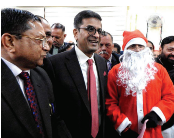
జస్టిస్ డీవై చంద్రమౌడ క్రిస్మస్ వేడుకల్లో సందడి చేశారు. అతిథులతో కలిసి క్రిస్మస్ పాటలు పాడి.. ఆందరిలోనూ ఉత్సాహం నింపారు. సుప్రీంకోర్టు బార్ ఆసోసియేషన్ల ఘనంగా క్రిస్మస్ వేడుకలు నిర్వహించింది. ఈ వేడుకలకు భారత ప్రధాన

పాదారు. ఇప్పుడు ఈ పాటలు వైరల్ గా మారాయి. వేదికపై వెళ్లిన సుప్రీంకోర్టు చిప్ జస్టిస్ డీవై చంద్రమౌడ, వేడుకల్లో పాటలు పడుతున్న వారిని అనుకరించారు. మైక్ పట్టుకుని.. వారితో పాటు పాటలు పాడి సందడి చేశారు. అంతేకాదు.. మిగతా వారిని కూడా ఎంకరేజ్ చేస్తూ మరింత హుషారెత్తించారు. మరోవైపు.. చిప్ జస్టిస్ రాకతో వేడుకల్లో పాల్గొన్నవారంతా హర్షం వ్యక్తం చేశారు. మణిపూర్ మారణహోమం తర్వాత క్రైస్తవుల్లో ఆత్మవిశ్వాసం దెబ్బతిందని, వారికి భరోసా కల్పిస్తూ జస్టిస్ చంద్రమౌడ పాటలు పాడారని సామాజికవేత్తలు విశ్లేషిస్తున్నారు.