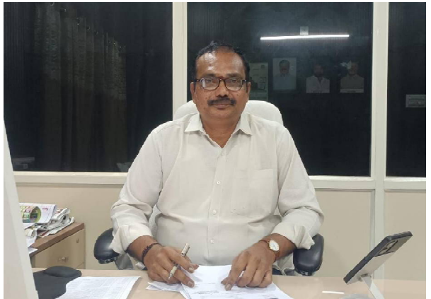
కరప, (రాజధాని వార్తలు): ఎన్టీఆర్ భరోసా పెన్నుల ఒక రోజు