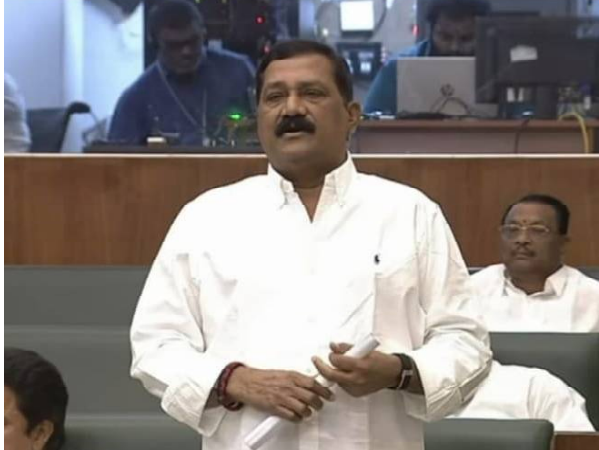
విశాఖపట్నం, (రాజధాని వార్తలు): ఆసియాలో అత్యంత వేగంగా అభివృద్ధి చెందుతున్న విశాఖలో ట్రాఫిక్ సమస్య పరిష్కారంపై

ప్రభుత్వం దృష్టి సారించాలని భీమిలి ఎమ్మెల్యే గంటా శ్రీనివాసరావు కోరారు. గురువారం ఆయన ఆసెంబ్లీలో మాట్లాడుతూ సీఆర్డీఎం మాదిరిగా ప్రతి వారం విశాఖ ట్రాఫిక్ పై సీఎం నారా చంద్రబాబు నాయుడు సమీక్ష జరపాలని సూచించారు. జూన్ 26న భోగాపురం ఎయిర్ పోర్టు ప్రారంభమైన తర్వాత ట్రాఫిక్ సమస్య మరింత జటిలం కానుందని ఆందోళన వ్యక్తం చేశారు. ప్రత్యామ్నాయంగా మెట్రో, కోస్టల్ కారిడార్, ఫ్లయ్ ఓవర్లు ప్రతిపాదించినప్పటికీ, వాటి నిర్మాణాల్లో ఎలాంటి పురోగతి లేదన్నారు. విశాఖలో 30 ఏళ్ల క్రితం రోడ్డు విస్తరించగా, వాహనాల సంఖ్య 5 రెట్లు పెరిగిందని తెలియజేశారు. గూగుల్ డేటా సింబల్ సహా ఐటీ, టూరిజం ప్రాజెక్టులు ఏర్పాటు కానున్న నేపథ్యంలో రాబోయే 4-5 ఏళ్లలో లక్ష మంది ఉద్యోగులు విశాఖ వస్తారని, ఆ స్థాయిలో వాహనాలు పెరిగితే ట్రాఫిక్ పరిస్థితి చాలా దారుణంగా ఉంటుందని పేర్కొన్నారు.