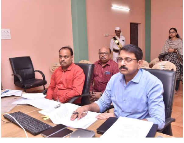
విజయనగరం, (రాజధాని వార్తలు): మే 3న నిర్వహించే నీట్