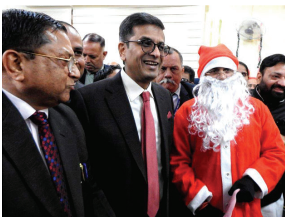
జస్టిస్ డీవై చంద్రచౌడ్ క్రిస్మస్ వేడుకల్లో సందడి చేశారు. అతిథులతో కలిసి క్రిస్మస్ పాటలు పాడి.. ఆందరిలోనూ ఉత్సాహం నింపారు. సుప్రీంకోర్టు బార్ ఆసోసియేషన్ ఘనంగా క్రిస్మస్ వేడుకలు నిర్వహించింది. ఈ వేడుకలకు భారత ప్రధాన

పాదారు. ఇప్పుడు ఈ పాటలు వైరల్ గా మారాయి. వేదికపై వెళ్లిన సుప్రీంకోర్టు చీఫ్ జస్టిస్ డీవై చంద్రచౌడ్, వేడుకల్లో పాటలు పడుతున్న వారిని అనుకరించారు. మైక్ పట్టుకుని.. వారితో పాటు పాటలు పాడి సందడి చేశారు. అంతేకాదు.. మిగతా వారిని కూడా ఎంకరేజ్ చేస్తూ మరింత హుషారెత్తించారు. మరోవైపు.. చీఫ్ జస్టిస్ రాకతో వేడుకల్లో పాల్గొన్నవారంతా హర్షం వ్యక్తం చేశారు. మణిపూర్ మారణహోమం తర్వాత క్రైస్తవుల్లో ఆత్మవిశ్వాసం దెబ్బతిందని, వారికి భరోసా కల్పిస్తూ జస్టిస్ చంద్రచౌడ్ పాటలు పాడారని సామాజికవేత్తలు విశ్లేషిస్తున్నారు.