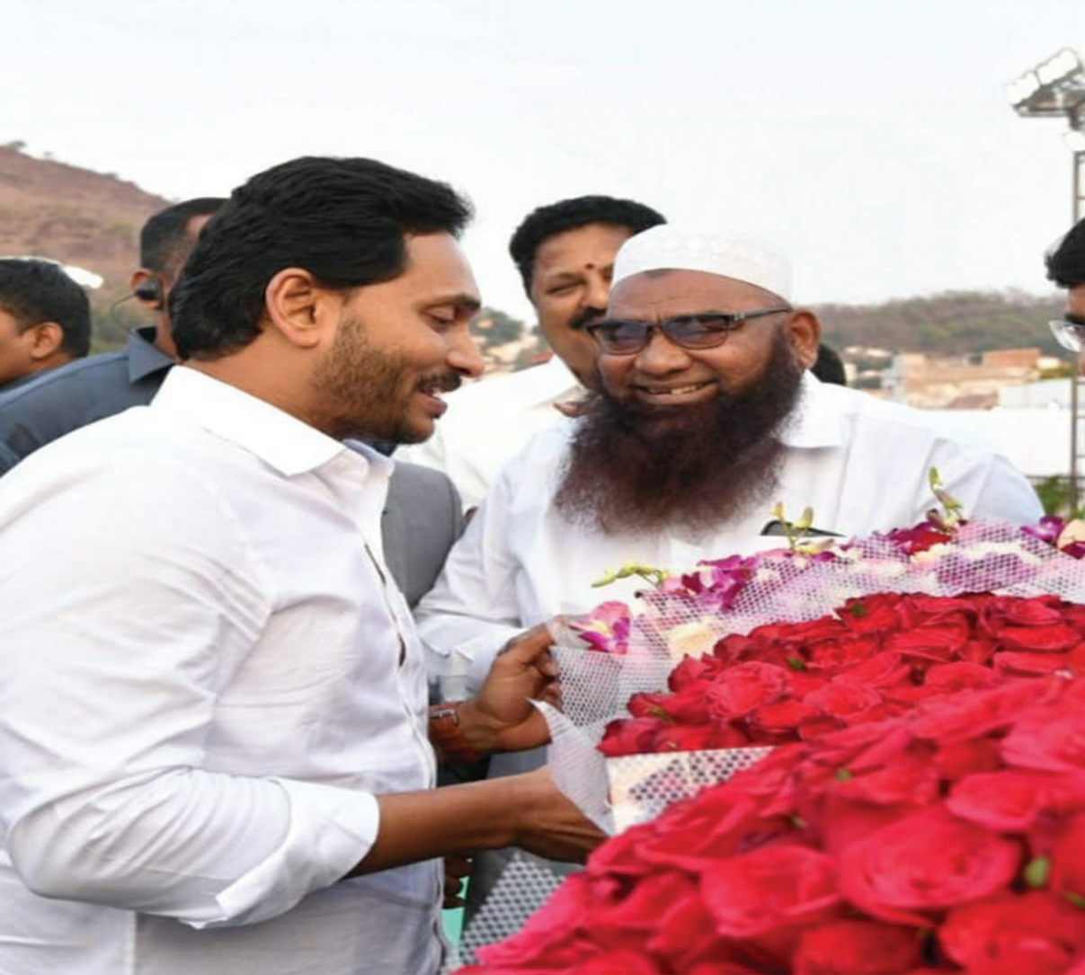
వై.ఎస్.రాజశేఖరరెడ్డి, నాకు రాజకీయ అవకాశాలు కల్పించి ప్రజలకు సేవచేసే హామీ ఇచ్చారు.