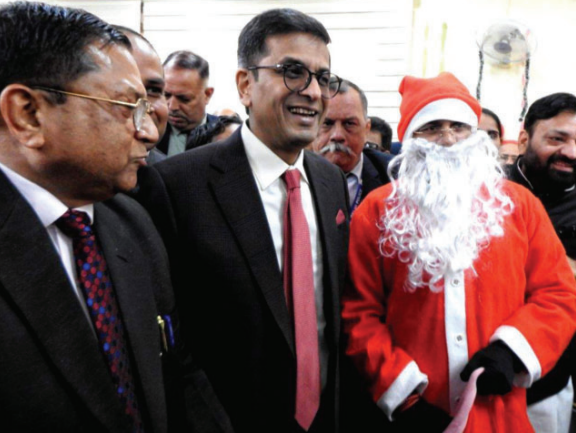
జస్టిస్ డీవై చంద్రచౌడ్ క్రిస్మస్ వేడుకల్లో సందడి చేశారు. అతిథులతో కలిసి క్రిస్మస్ పాటలు పాడి.. ఆందరిలోనూ ఉత్సాహం నింపారు. సుప్రీంకోర్టు బార్ ఆసోసియేషన్ల ఘనంగా క్రిస్మస్ వేడుకలు నిర్వహించింది. ఈ వేడుకలకు భారత ప్రధాన

పాదారు. ఇప్పుడు ఈ పాటలు వైరల్ గా మారాయి. వేదికపై వెళ్లిన సుప్రీంకోర్టు చీఫ్ జస్టిస్ డీవై చంద్రచౌడ్, వేడుకల్లో పాటలు పడుతున్న వారిని అనుకరించారు. మైక్ పట్టుకుని.. వారితో పాటు పాటలు పాడి సందడి చేశారు. అంతేకాదు.. మిగతా వారిని కూడా ఎంకరేజ్ చేస్తూ మరింత హుషారెత్తించారు. మరోవైపు.. చీఫ్ జస్టిస్ రాకతో వేడుకల్లో పాల్గొన్నవారంతా హర్షం వ్యక్తం చేశారు. మణిపూర్ మారణహోమం తర్వాత క్రైస్తవుల్లో ఆత్మవిశ్వాసం దెబ్బతిందని, వారికి భరోసా కల్పిస్తూ జస్టిస్ చంద్రచౌడ్ పాటలు పాదారుని సామాజికవేత్తలు విశ్లేషిస్తున్నారు.