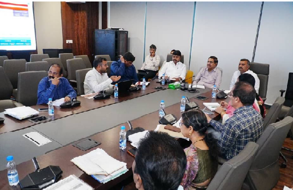
అమరావతి, (రాజధాని వార్తలు): అమరావతిలో ల్యాండ్ పూలింగ్ కొనసాగుతున్న తీరుపై అధికారులతో మంత్రి నారాయణ సమీక్ష. హాజరైన ఎమ్మెల్యేలు శ్రవణ్ కుమార్, భాష్యం ప్రవీణ్, సీఆర్డీయే కమిషనర్ విజయరామరాజు, అడిషనల్ కమిషనర్లు భార్య తేజ,

కార్మిక్, డిప్యూటీ కలెక్టర్లు, ఎమ్మార్వోలు. ప్రస్తుతం ల్యాండ్ పూలింగ్ గిల్తో భూములిస్తున్న రైతులకు మే 1 నుంచి కౌలు నిధులు జమ చేయాలని సమావేశంలో నిర్ణయం. ఇంటర్మీడియట్ స్టాఫ్ సిటీ, ఇన్స్టర్ రింగ్ రోడ్, రైల్వే లైన్, రైల్వే స్టేషన్ కోసం 7 గ్రామాల్లో కొనసాగుతున్న ల్యాండ్ పూలింగ్. ల్యాండ్ పూలింగ్ ప్రక్రియను వేగవంతం చేయాలని అధికారులను ఆదేశించిన మంత్రి నారాయణ. ఎంజాయ్మెంట్ సర్వే త్వరితగతిన చేయాలని అధికారులకు సూచించిన మంత్రి. లెగిస్లేషన్, ఫ్రెష్ వేస్ట్ నిర్వహణ ఏజెన్సీతో మంత్రి నారాయణ సమీక్ష. లెగిస్లేషన్ వ్యర్థాలను త్వరితగతిన పూర్తిగా తొలగించాలని ఆదేశించిన మంత్రి. ఫ్రెష్ వేస్ట్ ప్లాంట్ల ఏర్పాటు త్వరగా పూర్తి చేసి వ్యర్థాల నిర్వహణ ప్రారంభించాలని సూచించిన మంత్రి. ప్లాంట్ల ఏర్పాటుకు స్థలం ఇబ్బందిగా ఉన్న చోట కలెక్టర్లతో మాట్లాడి తగిన చర్యలు తీసుకోవాలని ఆదేశించిన మంత్రి.