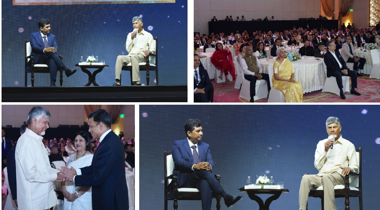
ముంబై: ప్రతిష్ఠాత్మక మీడియా సంస్థ ఎకనామిక్ టైమ్స్ ఎక్సలెన్స్ అవార్డుల కార్యక్రమానికి హాజరైన సీఎం చంద్రబాబు నాయుడు. అవార్డుల కార్యక్రమంలో ముఖ్యమంత్రి మాట్లాడిన ముఖ్యమంత్రి చంద్రబాబు. దేశంలో ఆర్థిక సంస్కరణల తర్వాత నేను ఉమ్మడి ఏపీ రాష్ట్రానికి ముఖ్యమంత్రిని కావటం నా అదృష్టంగా భావిస్తున్నాను. నాలుగున్నర దశాబ్దాల రాజకీయ జీవితంలో సంస్కరణలకు ముందు తర్వాత భారత దేశాన్ని క్షుణ్ణంగా అధ్యయనం చేశాను. సంస్కరణలకు అనుగుణంగానే విజన్ 2020ను అమలు చేశాం. ఇప్పుడు హైదరాబాద్ చూస్తున్న అభివృద్ధి ఫలాలు అవే. ప్రధాని నరేంద్ర మోడీ కూడా ఇప్పుడు 2047 వికసిత్ భారత్ రూపకల్పన చేశారు. అందులో ఏపీ అగ్రస్థానంలో ఉండాలన్నదే నా ఆకాంక్ష. 1990లో వచ్చిన ఐటీ విప్లవాన్ని అందిపుచ్చుకున్నాం. ఇప్పుడు క్యాంటన్, ఏబిలాంటి ఆధునిక టెక్నాలజీలు అందుబాటులోకి వచ్చేతాయి. ఇప్పుడు ఆ టెక్నాలజీలను అందిపుచ్చుకుని అభివృద్ధి దిశగా ముందుకు వెళ్లాల్సి ఉంది. గతంలో విద్యుత్ సంస్కరణల్ని కూడా ఆంధ్రప్రదేశ్ లో అమలు చేసి మిగులు విద్యుత్ సాధించాం. రాష్ట్రంలో వినియోగదారులకు మేలు కలిగేలా నియంత్రణా కమిషన్ ను కూడా తీసుకు వచ్చాం. సౌర, పునరుద్ధాదక విద్యుత్ కు కూడా పెద్దఎత్తున భారత్ లో ప్రోత్సాహం కల్పించాం. ఇప్పుడు గ్రీన్ ఎనర్జీ, బ్యాటరీ, పంప్ స్టోరేజీ, గ్రీన్ అమ్మోనియా లాంటి రంగాల్లో విద్యుత్ ఉత్పత్తి కావాలి. అప్పుడే ఇంధన రంగంలో భారత్ అగ్రస్థానంలో ఉంటుంది. డీజిల్, పెట్రోలు, గ్యాసోలాంటి ఇంధనాలతో పాటు విద్యుత్ ఉత్పత్తి అనేది కీలకం. తక్కువ వ్యయంతో విద్యుత్ ఉత్పత్తి చేస్తేనే మనకు ప్రయోజనాలు ఉంటాయి. 500 గిగావాట్ల గ్రీన్ ఎనర్జీ ఉత్పాదన చేయాలని ప్రధాని లక్ష్యం విధిస్తే అందులో ఏపీ 160 గిగావాట్ల