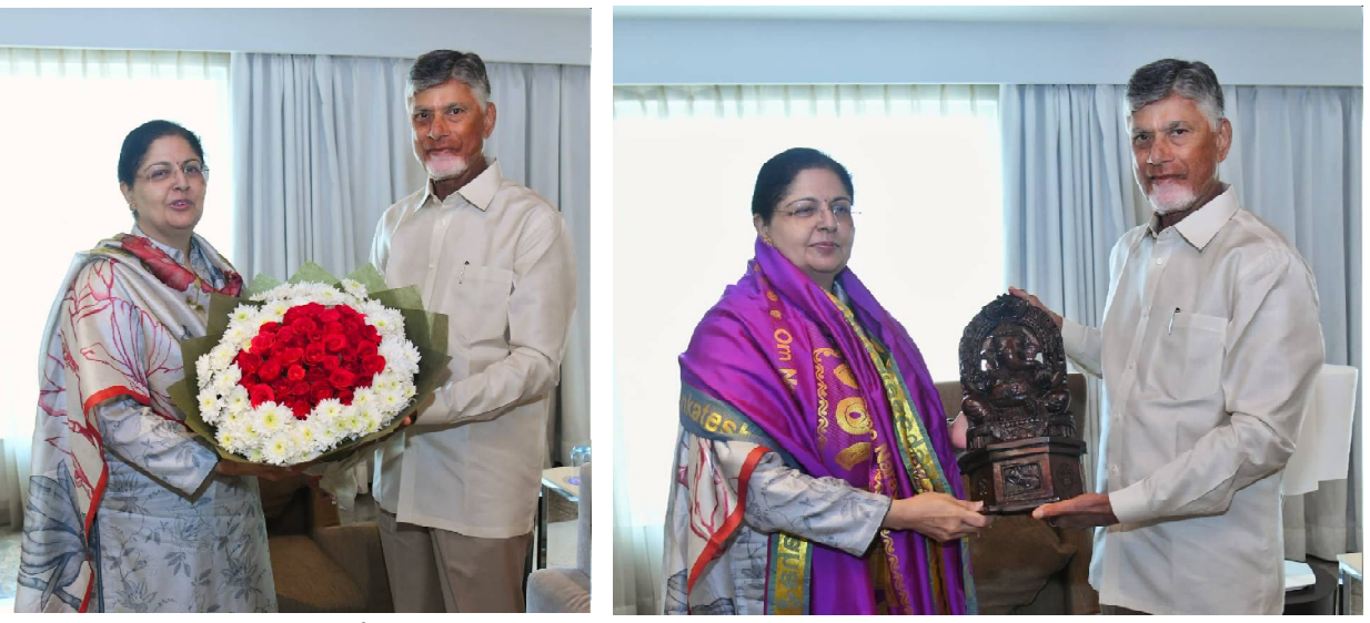
విజయవాడ, (రాజధాని వార్తలు): ఏపీ హైకోర్టు ప్రధాన న్యాయ మూర్తి జస్టిస్ లీసా గిల్తో మర్యాదపూర్వకంగా భేటీ అయిన ముఖ్యమంత్రి చంద్రబాబు నాయుడు. ఆంధ్రప్రదేశ్ హైకోర్టుకు తొలి మహిళా ప్రధాన న్యాయమూర్తిగా నియమితులైన జస్టిస్ లీసా గిల్ కు చుభాకాంక్షలు తెలిపిన సీఎం. లోక్ భవన్ లో ఏపీ హైకోర్టు చీఫ్ జస్టిస్ గా ప్రమాణం చేసిన జస్టిస్ లీసా గిల్.