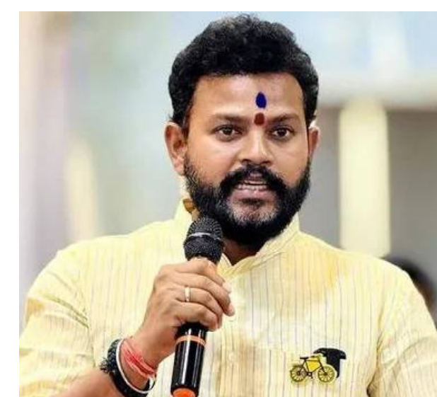
మిట్టల్ - నిపున్ స్టీల్ ఇండియా ప్లాంట్ ఇంజనీంగ్ మారసుంధని కేంద్ర మంత్రి రామ్మోహన్ నాయుడు పేర్కొన్నారు.

అనకాపల్లి, (రాజధాని వార్తలు): అనకాపల్లిలో మిట్టల్ స్టీల్ ప్లాంట్ ఏర్పాటు ఏపీ పాలిట్రామిక రంగంలో చాలిత్రాత్మక ఘట్టమని కేంద్ర మంత్రి కింజరాపు రామ్మోహన్ నాయుడు వ్యాఖ్యానించారు. అనకాపల్లిలో మిట్టల్ స్టీల్ ప్లాంట్ ఏర్పాటుపై హార్షం వ్యక్తం చేశారు. ఉత్తరాంధ్ర తలరాతను మార్చుతున్న మెగా స్టీల్ ప్లాంట్ ప్రాజెక్ట్ ఇదని పేర్కొన్నారు. దేశంలోనే అతిపెద్ద ఇంటిగ్రేటెడ్ గ్రీన్ ఫీల్డ్ స్టీల్ ప్లాంట్ గా ఏపీ ప్రాజెక్ట్ రికార్డు సృష్టించనుందని తెలిపారు. ఈ మేరకు ఆయన ఓ ప్రకటన విడుదల చేశారు. లక్షలాది మందికి పైగా నిరుద్యోగులకు ప్రత్యక్షంగా, పరోక్షంగా ఉద్యోగ అవకాశాలు కల్పించనుందని రామ్మోహన్ నాయుడు వ్యాఖ్యానించారు. ఏటా 17 మిలియన్ మెట్రిక్ టన్నుల ఉక్కు ఉత్పత్తి లక్ష్యంతో ఈ ప్రాజెక్ట్ ముందుకు సాగుతుందని వివరించారు. ఉత్తరాంధ్ర అభివృద్ధిలో ఈ ప్రాజెక్ట్ కీలక మైలురాయిని ఉద్ఘాటించారు. ప్రధానమంత్రి నరేంద్రమోదీ, సీఎం చంద్రబాబు, డిప్యూటీ సీఎం పవన్ కల్యాణ్ కృషితో ఈ భారీ ప్రాజెక్ట్ సాకారమైందని చెప్పుకొచ్చారు. రాష్ట్ర పాలిట్రామిక ప్రగతికి ఆర్పెలార