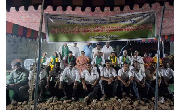
తెలుగుదేశం పార్టీ నాయకులు పాల్గొన్నారు.