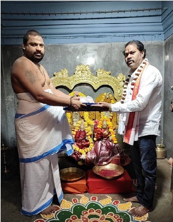
విశాఖపట్నం, (రాజధాని వార్తలు): సింహాద్రి నాధుడు సోదరి