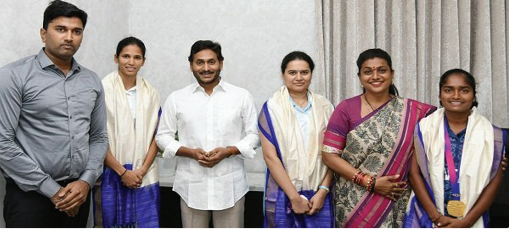
ఏపీ ప్రభుత్వం విడుదల చేసిన నగదు బహుమతి రూ. 20 లక్షలు. ఏషియన్ గేమ్స్లో గోల్డ్ మెడల్ విజేత, ఏపీ ప్రభుత్వం విడుదల చేసిన నగదు బహుమతి రూ. 30 లక్షలు. ఈ నగదు పురస్కారంతో పాటు గతంలో పతకాలు సాధించినందుకు ఇచ్చే ప్రోత్సాహక బకాయిలు మొత్తం కలిపి రూ. 4. 29 కోట్లు విడుదల చేసిన ప్రభుత్వం. ఇటీవల జరిగిన ఏషియన్ గేమ్స్లో ఏపీ క్రీడాకారులు మొత్తం 11 పతకాలు (5 గోల్డ్, 6 సిల్వర్) సాధించారు. ఈ కార్యక్రమంలో పాల్గొన్న పర్యాటక, సాంస్కృతిక, యువజన సర్వీసులు, క్రీడాశాఖ మంత్రి ఆర్కే రోజా, శావ్ ఎంఓ హెచ్.ఎం.ధ్యానచంద్ర, శావ్ అధికారి రామకృష్ణ.