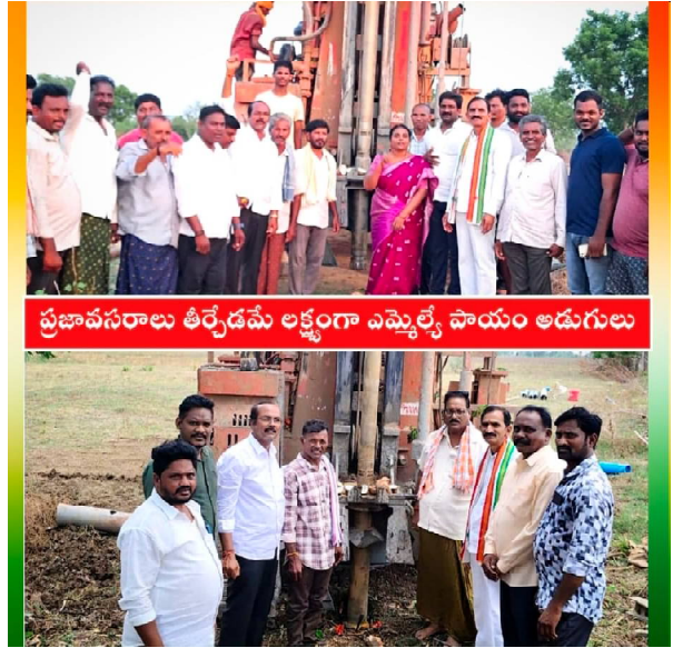
అశ్వాపురం, (రాజధాని వార్తలు): వేసవి దృష్ట్యా నీటి సమస్యలను ఎదుర్కొంటున్న పలు గ్రామాల ప్రజల వినతుల మేరకు అవసర

- వేసవిలో నీటిపొందడం తీర్చేందుకై రూ. 14 లక్షలు మంజూరు - ప్రజా వినతులకు స్పందించి వెంటనే తగు పనులకు శ్రీకారం