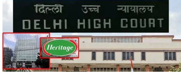
ఢిల్లీ: సాక్షి మీడియాపై హెరిటేజీ సంస్థ.. ఢిల్లీ హైకోర్టులో పరువు

నష్టం దామా వైసింది. సాక్షి మీడియాపై రూ.వంద కోట్లకు హెరిటేజీ సంస్థ దావా వేసింది. హెరిటేజీపై ప్రచురించిన వ్యతిరేక కథనాలను వెంటనే తొలగించాలని కోర్టు మధ్యంతర ఉత్తర్వులు జారీ చేసింది. కథనాలతో పాటు ప్రసారాల వీడియో లింకులను కూడా తొలగించాలని ఉత్తర్వులు ఆదేశించింది. హెరిటేజీకు వ్యతిరేకంగా ఎవరైనా రాసి ఉంటే.. వాటిని తొలగించాలని హుకుం జారీ చేసింది. తమ ఆదేశాలు పాటించని వారిపై కఠిన చర్యలు తప్పవని ఢిల్లీ హైకోర్టు స్పష్టం చేసింది.