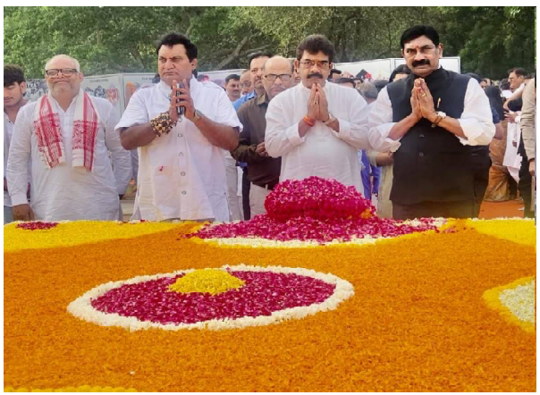
న్యూఢిల్లీ: మాజీ ప్రధాన మంత్రి చంద్రశేఖర్ 100వ జయంతి