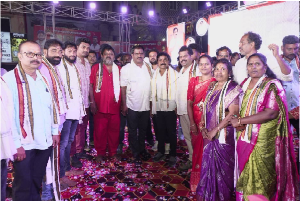
మాట్లాడుతూ గ్రామ దేవతల పండగలు వైభవంగా జరగడానికి ప్రతి ఒక్కరు ఎంతో కష్టపడ్డా రని, అమ్మవారి ఆశీస్సులు ప్రతి ఒక్కరు పైన ఉండాలని తెలిపారు. దక్షిణ నియోజకవర్గం అనేక ప్రాంతాల్లో నిరంతరం గ్రామ దేవత పండగలు జరుగుతున్నాయని అన్నారు. ఈ కార్యక్రమంలో నాయకులు, కార్యకర్తలు పాల్గొన్నారు.