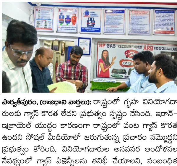
పార్వతీపురం, (రాజధాని వార్తలు): రాష్ట్రంలో గృహ వినియోగదారులకు గ్యాస్ కొరత లేదని ప్రభుత్వం స్పష్టం చేసింది. ఇరాన్-ఇజ్రాయేల్ యుద్ధం కారణంగా రాష్ట్రంలో వంట గ్యాస్ కొరత ఉందని సోషల్ మీడియాలో జరుగుతున్న ప్రచారం సమ్మోర్దని ప్రభుత్వం కోరింది. వినియోగదారుల అనవసర ఆందోళనల నేపథ్యంలో గ్యాస్ ఏజెన్సీలను తనిఖీ చేయాలని, సంబంధిత