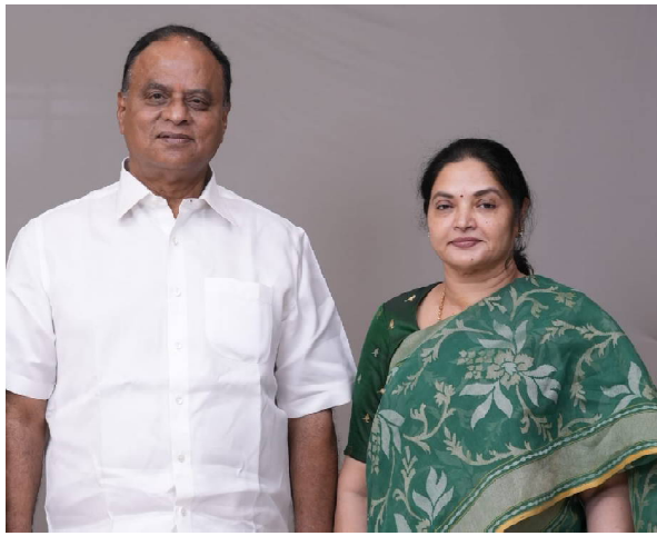
నెల్లూరు, (రాజధాని వార్తలు): శివం అంటే చైతన్యమని, శివుడు