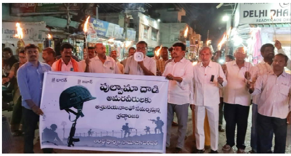
పెద్దాపురం, (రాజధాని వార్తలు): 2019 ఫిబ్రవరి 14న పూర్వపు