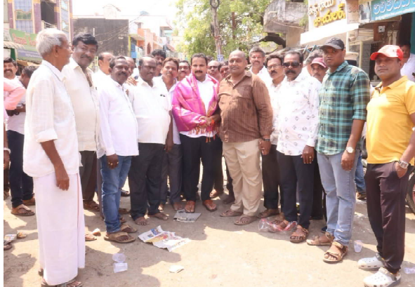
కందుకూరు, (రాజధాని వార్తలు): కందుకూరు పట్టణంలోని పెద్ద