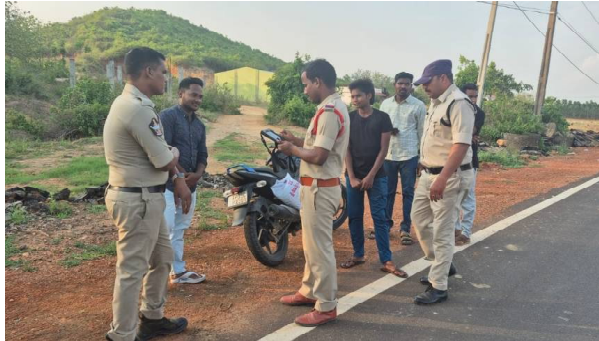
మక్కువ, (రాజధాని వార్తలు): మైనర్లకు వాహనాలపై సంబంధిత