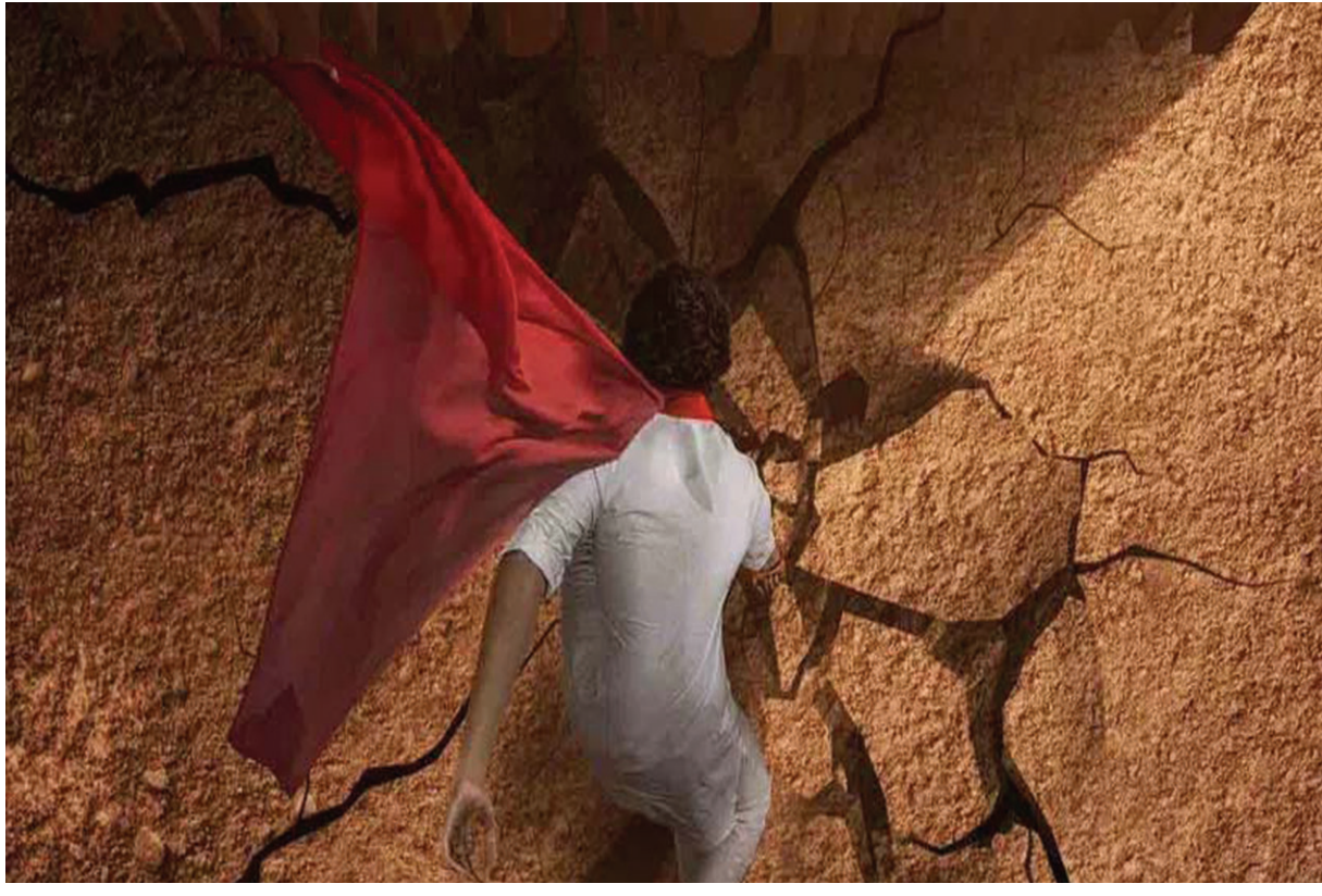
'హనుమాన్' ట్రైలర్ తేదీ వచ్చేసింది!