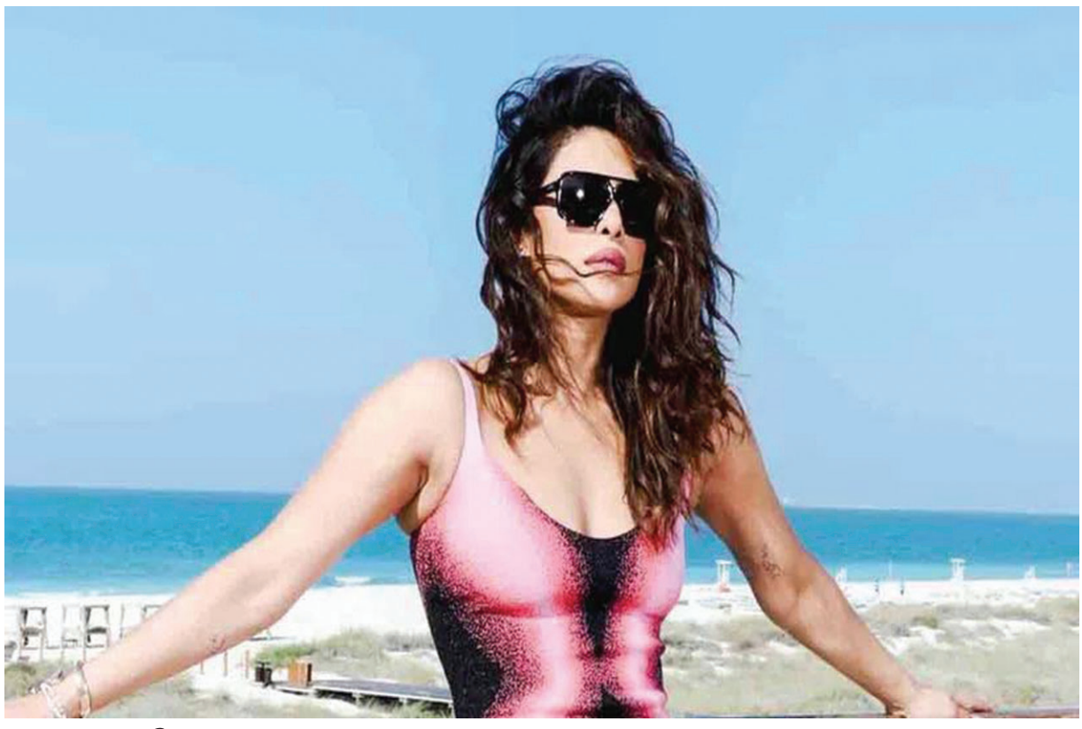
డీవ్ ఫేక్ బాలిన ప్రియాంక చోప్రా!