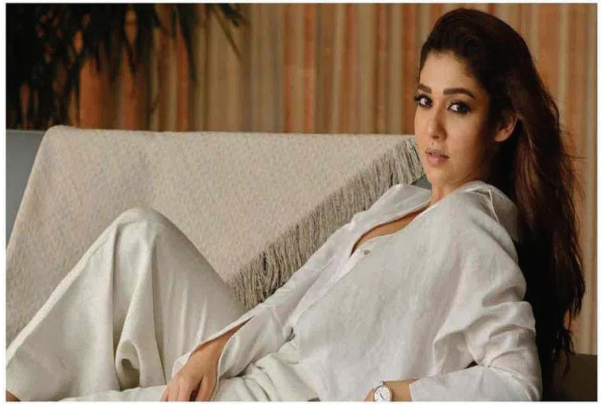
మళ్ళీ భర్త విఘ్నేశ్ శివన్ డ్యారెక్షన్ లో నయనతార!