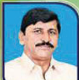
నలమలపు క్రీషిరెడ్డి (బుల్లెట్) YSRCP నాయకులు