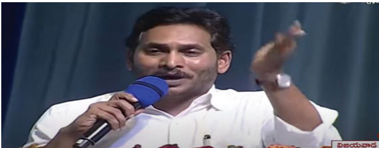
నిర్ణయం తీసుకున్నాం. 13 జిల్లాల ఆంధ్రప్రదేశ్ లో 26 జిల్లాలుగా ఏర్పాటు చేస్తూ అడుగులు వేయగలిగాం.

గ్రామస్థాయిలో ఇంతకుముందు చూడని విధంగా సచివాలయాల వ్యవస్థ, చలంఠీర్ వ్యవస్థను తీసుకువచ్చాం. ఇవన్నీ కూడా గతంలో ఎప్పుడూ చూడలేదు.