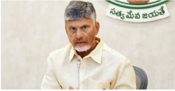
కాకినాడ జిల్లా, (రాజధాని వార్తలు): కాకినాడ జిల్లా సామర్లకోట

మండలం వేట్లపాలంలో బాణసంచా తయారీ కేంద్రంలో భారీ పేలుడు సంభవించింది. ఈ ప్రమాదంలో మృతుల సంఖ్య అంతకంతకూ పెరుగుతోంది. అయితే, వేట్లపాలంలో బాణసంచా ప్రమాద స్థలిని ముఖ్యమంత్రి చంద్రబాబు నాయుడు పరిశీలించారు. జిల్లా కలెక్టర్ వాహనంలో వేట్లపాలం చేరుకున్నారు. బాణసంచా పేలుడు బాధిత కుటుంబాలను పరామర్శించారు. పేలుడు ఘటనపై సీఎం చంద్రబాబు ఆరా తీశారు. పేలుడు ఘటన తీరును అధికారులు సీఎంకి వివరించారు. ఈ ఘటనపై పూర్తి నివేదిక ఇవ్వాలని ఆదేశాలు జారీ చేశారు.