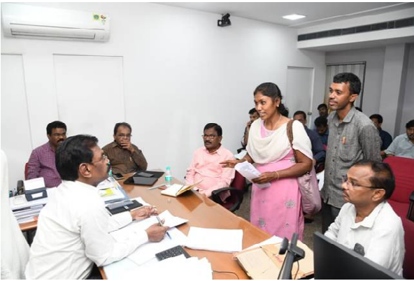
జోన్ కు 03 వినతులు వచ్చాయని తెలిపారు. స్వీకరించిన వినతులను ఫిర్యాదులను నిర్ణీత సమయంలో టౌన్ ప్లానింగు అధికారులు వెంటనే స్పందించి పరిష్కరించాలని ఆదేశించడమైనదన్నారు. పట్టణ ప్రణాళికా విభాగమునకు సంబంధించి ఫిర్యాదులు, అర్జీలు మొదలైనవి ప్రతి శుక్రవారం టౌన్ ప్లానింగ్ ఓపెన్ ఫోరమ్ కార్యక్రమంలో ప్రజలు నమోదు చేసుకోవచ్చునని తెలిపారు.