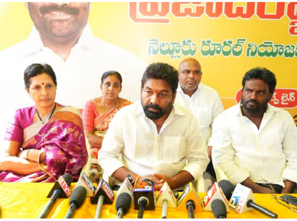
నెల్లూరు, (రాజధాని వార్తలు): రూరల్ నియోజకవర్గం ప్రజలకు ప్రతినిత్యం అందుబాటులో ఉంటున్నామని టిడిపి నాయకులు కోటంరెడ్డి గిరిధర్ రెడ్డి తెలిపారు. శుక్రవారం ఉదయం నెల్లూరు రూరల్ ఎమ్మెల్యే కార్యాలయంలో నిర్వహించిన ప్రజాదర్శార్

కార్యక్రమంలో ఆయన మాట్లాడారు. నెల్లూరు రూరల్ ఎమ్మెల్యే కార్యాలయంలో నెల్లూరు రూరల్ ప్రజలకు ప్రతిరోజు ఉదయం 7 గంటల నుండి రాత్రి 8 గంటల వరకు ప్రజా దర్శార్ నిర్వహిస్తున్నామని చెప్పారు. రాష్ట్ర ముఖ్యమంత్రి నారా చంద్రబాబు నాయుడు, యువనేత, రాష్ట్ర మంత్రి నారా లోకేశ్ ఆదేశాల మేరకు ప్రతి శుక్రవారం నెల్లూరు రూరల్ ఎమ్మెల్యే కార్యాలయంలో ఉదయం 10 గంటల నుండి మధ్యాహ్నం 12 గంటల వరకు ప్రజాదర్శార్ కార్యక్రమం నిర్వహిస్తామని వెల్లడించారు. ప్రజా దర్శార్ లో ప్రజలు తెలివిన సమస్యలకు పరిష్కారం దిశగా చేపట్టవలసిన చర్యలు అధికారులతో కలిసి ఎప్పటికప్పుడు సమన్వయం చేస్తున్నామని చెప్పారు. పరిష్కారం అయ్యే ప్రతి సమస్యను పరిష్కరిస్తామన్నారు. ప్రజా దర్శార్లో ప్రజల నుండి వచ్చిన వినతులలో ఇప్పటికే 27 కోట్లతో 240 అభివృద్ధి పనులకు శంకుస్థాపన చేసామన్నారు. శరవేగంగా పనులు సాగుతున్నాయని, అతి త్వరలోనే వాటిని ప్రారంభిస్తామని తెలిపారు.