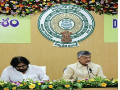
పివీ (పీ3) తో భిష్టుంగా ముందుకు వెళ్దాం. విజయం సాధించాం. - ఇప్పుడు పబ్లిక్ ప్రైవేట్ పీపుల్స్ పార్ట్ నర్ షిప్(పీ4) మోడల్ తో ముందుకు వెళ్దాం - ప్రస్తుతం పెన్షన్లపై నెలకు రూ. 2,730 కోట్లు, ఏడాదికి 33వేల కోట్లు, ఐదేళ్లకు 1,63, 000 కోట్లు ఖర్చు చేస్తున్నాం. - గత ప్రభుత్వంలో బస్ నీ సౌకర్యం తప్ప, ప్రజలను పరామర్శించలేదు - మీటింగ్ లకు బలవంతంగా మనపలను తీసుకోవ్వ ఇబ్బందులు పెట్టారు. - త్వరలోనే "పేదల సేవలో" అనే కార్యక్రమం క్రింద మనం అనుసంధానం అవుదాం. - పేదవారిని చూసేప్పుడు మనసు వలింపాలి. ఏం చేస్తే పేదరికం పోతుందో ఆలోచించాలి. - జీకో పావర్టీ అనేది మన ప్రభుత్వ లక్ష్యం - ఈజీ ఆఫ్ పబ్లిక్ సర్వీసెస్ రావాలి. - ప్రజల జీవనప్రమాణాలు మెరుగయ్యేలా చేయాలి - మానవతా దృక్పథంతో ఆలోచిస్తే సమస్యలకు పరిష్కారం చేయగలం. అలాంటి ఆలోచనకు అధికారులు శ్రీకారం చుట్టాలి - నియంత(డిక్టేటర్) - మానవతా దృక్పథంతో ఎవరూ మళ్ళీ గెలవలేదు. - ఎవరూ తప్పులు చేయకూడదు. - ప్రజా ప్రతినిధులు వాస్తవాన్ని మీ దృష్టికి తీసుకువచ్చినప్పుడు సంబంధిత సమస్యలను పరిష్కరించాలి.

- నాయకత్వం అంటే ఓనర్ షిప్ గా భావించాలి. ప్రతి ఒక్క అధికారి ప్రభుత్వం చేసే కార్యక్రమాలను ఓన్ చేసుకోవాలి. సమర్థవంతంగా పనిచేయాలి - నేను తప్పు చేసినా కలెక్టర్ చేసుకుంటాను. మీరు కూడా కలెక్టర్ చేసుకోవాలి. - సింపుల్ గవర్నెన్స్, పబ్లిక్ గవర్నెన్స్ ఉండాలి - నేను పర్యటనలకు వచ్చినప్పుడు చెట్ల సరికేయడం, రదాలు కట్టడం, స్కూలు బండ్ చేయడం, రెడ్ కార్పెట్లు వేయడం ఇలాంటివి చేయకూడదు. సరికాదు. - ప్రజలకు సేవ చేయడంలో ఎలాంటి ఆసాకర్యం కలిగించొద్దు - ఎమ్మెల్యేలు సైరెన్ వేసుకోవడం వంటివి ప్రజల్లో వ్యతిరేకత కలిగించేవి. - అడ్వైస్మెంట్ సర్వీస్ మోడ్ లో వెళ్లాలి - విజిలుల్, ఇన్ విజిలుల్ పోలిసింగ్ ఉండాలి - నాడు 15వేల సీని కెమెరాలు రాష్ట్రంలో పెట్టాం - మారుమూల గ్రామంలో కూర్చొని ఐదే కంపెనీ క్రియేట్ చేసి గ్లోబల్ గా తీసుకెళ్లే పరిస్థితులు వచ్చాయి. టెక్నాలజీ, మంచి నాయకత్వం, చేయగలిగే సత్తా ఉండాలి. ఏదైనా సాధించవచ్చు. - వర్చువల్ గవర్నెన్స్ రావాలి. - అధికారులు వాల్టావ్ గ్రామ్ క్రియేట్ చేసుకోవాలి. - టీసీఎన్ కంపెనీలో ఒక గ్రూప్ ఉంది. అందులో అందరూ ఉంటారు. - సమస్యలు చేసుకుంటారు. - త్వరలో గవర్నమెంట్ కు కూడా ఒక యాప్ తీసుకొస్తాం. అప్పుడే రియల్ టైమ్ లో గవర్నెన్స్ ఇవ్వే అవకాశం వస్తుంది - మంచిన చెప్పడం, ప్రజలకు మార్గదర్శకత్వం అందించాలి - ఇన్ఫర్మేషన్ బ్రాడ్ కాస్టింగ్ సిద్ధం చేద్దాం. - భట్టిప్రోలు ఫుటనలో ఒక కార్యక్రమం ఎన్ఎస్ ఐఎస్ వట్టుకున్నారని కల్పిత కథనం రాశారు. మనం వాస్తవాల వెల్లడించవలసి నిజమనుకునే అవకాశం ఉంది. - తప్పు చేస్తే ఎవరినీ పదిలిపెట్టం - ఢిల్లీ వెళ్లి ధర్మా చేసి ఏపీలో 36 మందిని చంపామని నినదించారు. నిజంగా అలా జరిగి ఉంటే ఎఫ్ఐఆర్ లు ఇవ్వాలి. కానీ ఎఫ్ఐఆర్ ఇవ్వమంటే ఎందుకు ఇవ్వడం లేదు? ఆధారాలంటే చూపించాలి. ప్రభుత్వంపై ఇలా