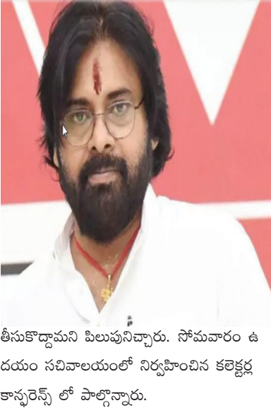
తీసుకొచ్చామని పిలుపునిచ్చారు. సోపానం ఉదయం సచివాలయంలో నిర్వహించిన కలెక్టర్ల కాన్ఫరెన్స్ లో పాల్గొన్నారు.

4721 కిలోమీటర్ల రోడ్లను మరమ్మత్తు చేయాలని నిర్ణయించుకున్నాం. రాష్ట్ర వ్యాప్తంగా 29.23 శాతం 37,400 చదరపు కిలోమీటర్ల నోటీఫై చేసిన అడవులు ఉన్నాయి. నోటీఫై చేసిన అటవీ పరిధికి అడవంగా 10,221 చదరపు కిలోమీటర్ల గ్రీన్ కారిడార్ ఉంది. చెరువు తీరాలు, ఇన్స్టిట్యూషన్ ల్యాండ్స్, పంచాయతీ ల్యాండ్స్ లో కూడా అటవీకరణను ప్రోత్సహించాలి' ఉంది. గుంటూరు, కర్నూలు, పశ్చిమ గోదావరి జిల్లాల్లో అటవీ పరిధి తక్కువగా ఉంది. ఇక్కడ అడవులు పెంచేందుకు కృషి చేయాల్సి ఉంది.