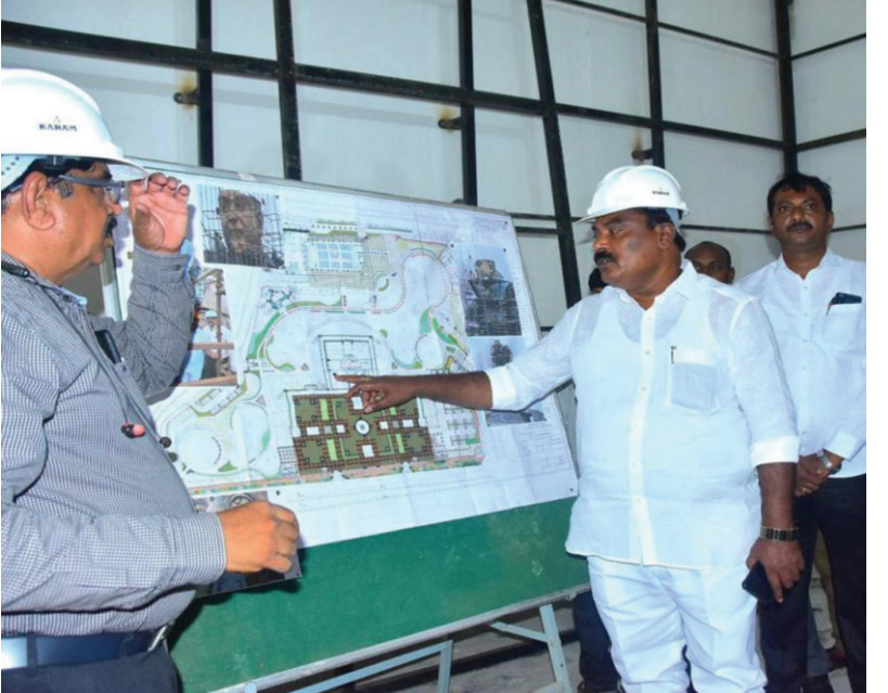
ప్రారంభిస్తారని మంత్రి మేరుగు నాగార్జున చెప్పారు. మోసం చేశాడని మండిపడ్డారు. తమకు సమవత్తేకానీ లోకేష్ కు తాము సమాధానం చెప్పాల్సిన అవసరం లేదన్నారు.

విజయవాడ: స్వరాజ్య మైదానంలో అంబేద్కర్ విగ్రహం, స్మృతిపాఠం నిర్మాణ పనులను డిప్యూటీ సీఎం కొట్టు సత్యనారాయణ, సాంఘిక సంక్షేమ శాఖ మంత్రి మేరుగు నాగార్జున పరిశీలించారు. ఏపీ చరిత్రలో నూతన శకం నెలకొందని, రూ. 420 కోట్లతో విజయవాడ నడిబొడ్డున 125 అడుగుల అంబేద్కర్ విగ్రహాన్ని ఏర్పాటు చేస్తున్నామని మంత్రి మేరుగు నాగార్జున చెప్పారు. నిర్మాణ పనులు తుది దశకు చేరుకున్నాయని చెప్పారు. అంబేద్కర్ విగ్రహం, స్మృతిపాఠాన్ని దేశంలోనే ఓ చారిత్రాత్మక ప్రాంతంగా తీర్చిదిద్దాలని సీఎం భావించారని, అందుకు తగ్గట్టుగానే నిర్మాణ పనులు కూడా కొనసాగుతున్నాయని చెప్పారు. త్వరలోనే అంబేద్కర్ విగ్రహాన్ని సీఎం వైయస్ జగన్