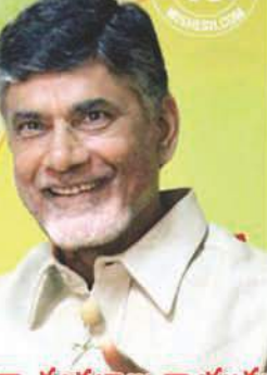
నారా చంద్రబాబు నాయుడు