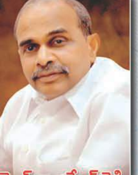
వైఎస్ రాజశేఖర్ రెడ్డి