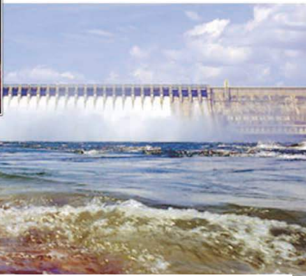
నాగార్జునసాగర్ బ్రహ్మకర్మ సాధక ప్రాజెక్టు

పంచవర్ష ప్రణాళితో నవభారత నిర్మాణానికి శ్రీకారం చుట్టిన దార్శనికుడు, స్వతంత్ర భారత తొలి ప్రధాని జవహర్లాల్ నెహ్రూ రాష్ట్రంలో కృష్ణానదిపై నిర్మించిన రెండు భారీ ప్రాజెక్టులు శ్రీశైలం, నాగార్జునసాగర్లకు శంకుస్థాపన చేశారు.