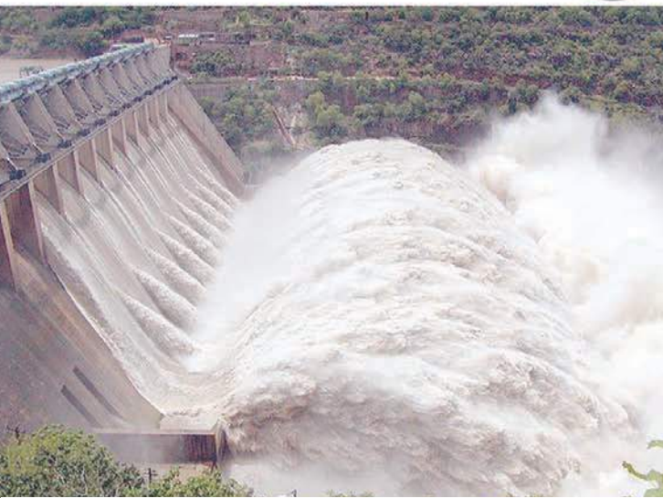
శ్రీశైలం జలవిద్యుత్ ప్రాజెక్టు