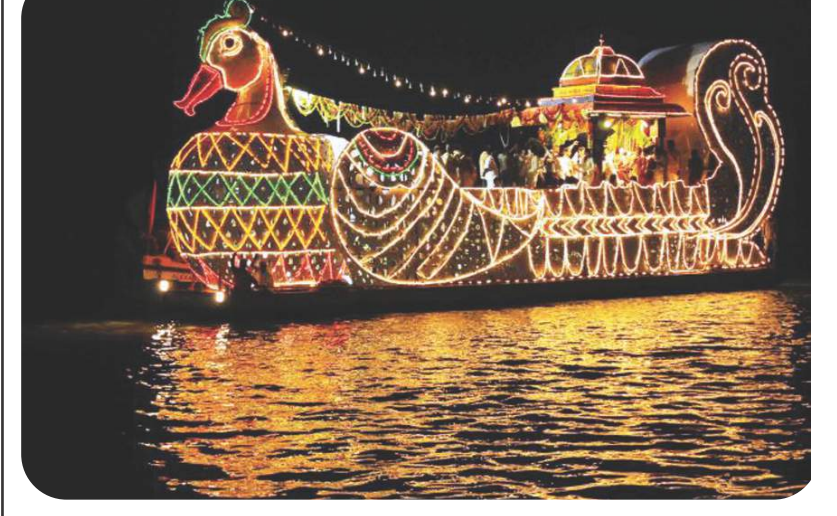
విజయదశమి రోజు తెప్పొత్సవంతో కనకదుర్గ అమ్మవారి నవరాత్రి ఉత్సవాల ముగింపు