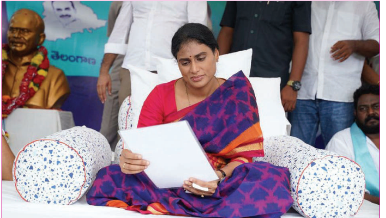
రాజధాని వార్తలు, హైదరాబాద్: ఇటీవల నిరుద్యోగుల కోసం నిరాహార దీక్షలో భాగంగా ఖమ్మం జిల్లా శత్రుపల్లి నియోజకవర్గం పెనుబల్లి మండలం గంగాదేవిపాడు గ్రామంలో వైఎస్ షర్మిలమ్మ నిరాహార దీక్షకు పెద్దపెత్తున్న సంఘభావం తెలుపుతున్న ప్రజలు...