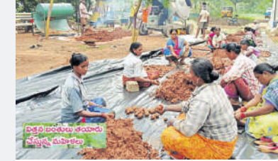
ఏమిటి విత్తన బంతులు?

ప్రత్యేకంగా సురక్షణ అవసరం లేకుండా.. ప్రకృతి సిద్ధంగా త్వరగా పెరిగే చెట్ల రకాలకు అధికారులు విత్తన బంతుల పద్ధతి అమలు చేస్తున్నారు. ముందుగా మన చోటవనానికి అనుకూలమైన చింత, వేప, కానుగ, రెల్ల, కుంకుడు, ఏగిన మొదలైన చెట్ల నుంచి విత్తనాలు సేకరిస్తారు. జలైద పట్టిని ఎర్రమట్టిని సిద్ధం చేస్తారు. 75 శాతం ఎర్రమట్టిలో 25 శాతం అప్పుడే, కొంత కోకాపిట్లను కలిపి ఎర్రపు మిశ్రమంగా తయారు చేస్తారు. ఈ మిశ్రమాన్ని కలిపి వీరం రోజులు మురగజేడతారు. అనంతరం జీవేచ్ఛాతం(అప్పుడే, బెల్లం, శనగపిండి)తో మిశ్రమాన్ని మద్దలగా తయారు చేస్తారు. ఇవి వీడిపోకుండా గట్టిగా ఉండేందుకు స్ట్రాబ్ లిక్విడ్, బిబిల్ గ్లూ ద్రావణాలు మట్టి ముద్దలో కలుపుతారు. ఈ మట్టి ముద్దలో విత్తనాలను పెట్టి ఎండబెట్టారు. తొలకరి పర్ణిలు పడిన తర్వాత కండకాలు, గుట్టలు, కొండలు, సాగుకు పనికిరాని భూముల్లో వినుతుంటారు. అటవీ జాతి మొక్కల కావడంతో సీడ్ బాల్స్ నుంచి విత్తనాలు త్వరగా మొలకెత్తతాయి.