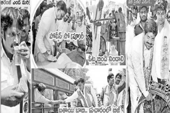
కరెంట్ ఎడ వేరి! ఇదే ప్రజల పని!