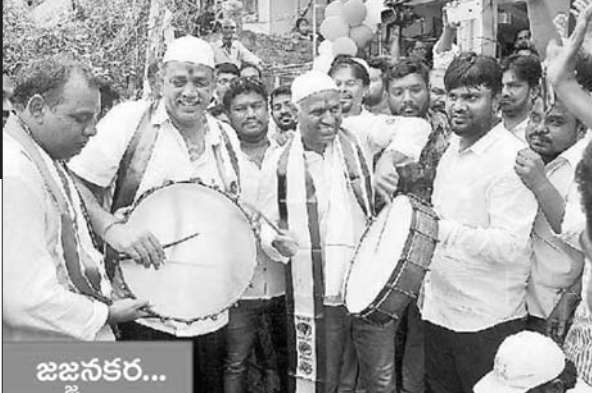
ప్రచారం చేస్తున్న పిపి