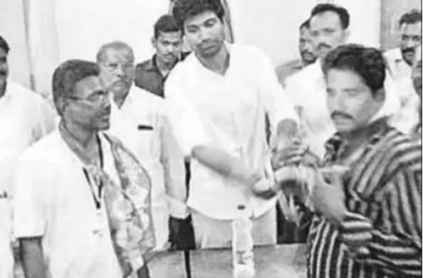
కార్వంటర్లను పార్టీలోకి ఆహ్వానిస్తున్న పార్లమెంట్ లభ్యర్థి శ్రీకృష్ణదేవరాయలు