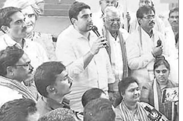
ప్రచారం చేస్తున్న మంత్రి లోకేశ్