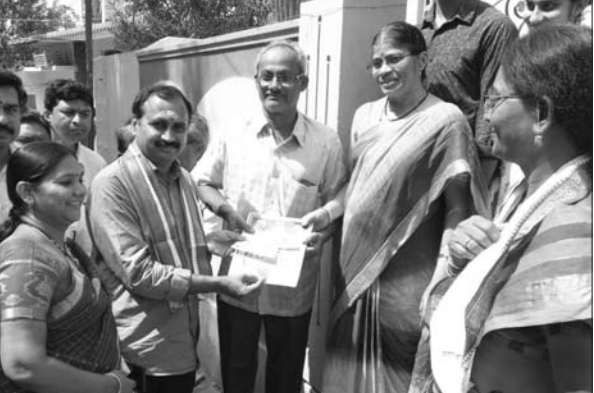
ప్రచారం చేస్తున్న అర్జే