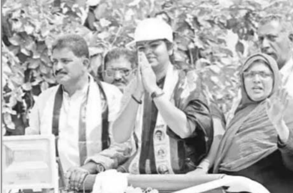
ప్రచార రథంపై నుంచి ప్రజలకు సమస్యలొస్తున్న విషయం రజని