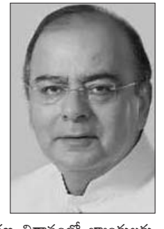
సూర్యపేట : నిరర్థక ఆస్తుల (ఎన్సీఏ)తో సహజమవుతున్న బ్యాంకులకు రెండేళ్లపాటు 2.11లక్షల కోట్ల రూపాయలను మూలధనంగా అందజేస్తామని కేంద్రం ప్రకటించింది. ఇందులో 1.35 లక్షల కోట్ల రూపాయలను పున:పెట్టుబడులు బాండ్లకేంద్రం ఇస్తామని, మిగిలిన 70 వేల కోట్ల రూపాయలను ఇంటెజ్రేట్ మార్కెట్లలో అందజేస్తామని ఆర్థిక విభాగపు కార్యదర్శి రాజీవ్ శర్మ తెలిపారు. కేంద్ర ఆర్థిక మంత్రి అరుణ్ జైల్లీ, ఆర్థిక విభాగపు కార్యదర్శి రాజీవ్ శర్మ విలేజ్ లులో మాట్లాడారు. పన్నెండ్ల నిరర్థక ప్రకటించుకున్న బ్యాంక్ సంస్కరణ విధానంలో బ్యాంకులకు దశలవారిగా అందించే మూలపెట్టుబడులను ఏ రకంగా అందించేది తెలియజేస్తామని జైల్లీ తెలిపారు. బాండ్ల విషయం ఏవిధంగా ఉంటుందో ప్రజలకు త్వరలోనే వెల్లడిస్తామని ఆయన చెప్పారు. 2015 మార్చి నాటికి బ్యాంకుల ఎన్సీఏలు 2.75 లక్షల కోట్లకు చేరుకున్నాయని, 2017కు అని 7.33 లక్షల కోట్లకు పెరిగాయి. ఇండ్రాధున్వీ పథకం కింద బ్యాంకులు 18 వేల కోట్ల రూపాయలు పొందుతాయని ఈయన పేర్కొన్నారు.

దశలవారిగా అందిస్తాం : జైల్లీ సూర్యపేట : నిరర్థక ఆస్తుల (ఎన్సీఏ)తో సహజమవుతున్న బ్యాంకులకు రెండేళ్లపాటు 2.11లక్షల కోట్ల రూపాయలను మూలధనంగా అందజేస్తామని కేంద్రం ప్రకటించింది. ఇందులో 1.35 లక్షల కోట్ల రూపాయలను పున:పెట్టుబడులు బాండ్లకేంద్రం ఇస్తామని, మిగిలిన 70 వేల కోట్ల రూపాయలను ఇంటెజ్రేట్ మార్కెట్లలో అందజేస్తామని ఆర్థిక విభాగపు కార్యదర్శి రాజీవ్ శర్మ తెలిపారు. కేంద్ర ఆర్థిక మంత్రి అరుణ్ జైల్లీ, ఆర్థిక విభాగపు కార్యదర్శి రాజీవ్ శర్మ విలేజ్ లులో మాట్లాడారు. పన్నెండ్ల నిరర్థక ప్రకటించుకున్న బ్యాంక్ సంస్కరణ విధానంలో బ్యాంకులకు దశలవారిగా అందించే మూలపెట్టుబడులను ఏ రకంగా అందించేది తెలియజేస్తామని జైల్లీ తెలిపారు. బాండ్ల విషయం ఏవిధంగా ఉంటుందో ప్రజలకు త్వరలోనే వెల్లడిస్తామని ఆయన చెప్పారు. 2015 మార్చి నాటికి బ్యాంకుల ఎన్సీఏలు 2.75 లక్షల కోట్లకు చేరుకున్నాయని, 2017కు అని 7.33 లక్షల కోట్లకు పెరిగాయి. ఇండ్రాధున్వీ పథకం కింద బ్యాంకులు 18 వేల కోట్ల రూపాయలు పొందుతాయని ఈయన పేర్కొన్నారు. ఆర్థికరంగం శక్తిమంతం నూతన్ ఆర్థిక నిబంధనలతో దేశ ఆర్థిక వ్యవస్థ శక్తిమంతంగా ఉందని జైల్లీ వెల్లడించారు. కొన్ని ఆంశాల్లో మరంత ప్రోత్సాహం అవసరమని, డీడీపీ ఆధారంగా ఆర్థిక పరిస్థితిని ప్రభుత్వం అంచనా వేస్తోందని ఆయన తెలిపారు. ఆర్థికరంగంపై ప్రభుత్వం మార్గదర్శకాలను రూపొందించిన, దీర్ఘకాలిక డీడీపీ వృద్ధిపై దృష్టిపెట్టాలని ఆయన చెప్పారు.