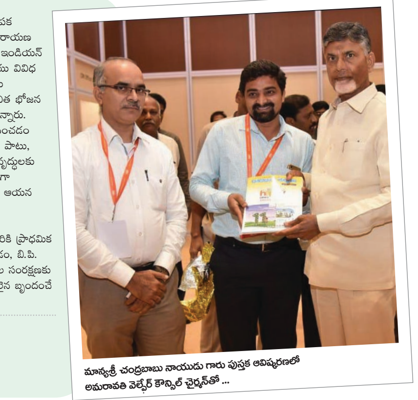
మాస్కెట్ చంద్రబాబు నాయుడు గారు పుస్తక అవిష్కరణలో అమరావతి వెల్డర్ కౌన్సిల్ చైర్మన్ తో...