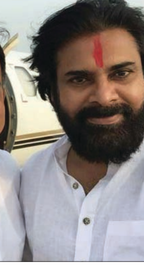
వేసి సమన్వయం అందరికీ చేస్తే బాగుంటుందని కార్యకర్తల ఆకంక్షిస్తున్నారు. తద్వారా రాజ్యాధికారం అందరికీ చేరువుతుందని ఒకళ్లిద్దరని పైసవేసుకుని తిరగటం సరికాదని సీనియర్ నేత భావిస్తున్నారని కార్యకర్తలు తెలుపుతున్నారు.

సాన్నిహిత్యం కేవలం నాదెండ్ల మనోహర్ మాత్రమే ఎందుకు దక్కుతుందని కార్యకర్తలు, ఎప్పుడినుంచో పార్టీకోసం పనిచేస్తున్న సీనియర్ నాయకులు వాపోతున్నారు. పార్టీలో చేరిన నాటి నుండి పవన్ తన పక్కనే మనోహర్ ను తాను ఎక్కడికి వెళ్లే అక్కడకు తీసుకెళ్లడం పార్టీలోని సీనియర్ నాయకులకు సచ్చని విషయం. ఇటీవల భారీగా జరిగిన కమాతు సభలో కూడా నాదెండ్లను పవన్ ప్రక్కన ఉంచడం కార్యకర్తలకు ఆశ్చర్యాన్ని కలిగిస్తోంది. సూచనలు, సలహాలు తీసుకొవచ్చుకాని ఎప్పుడి నుంచో పని చేస్తోన్న సలహాదారులు, రాజకీయ విశ్లేషకులు, నాయకులు మాత్రం ఈ విషయంలో ఒకరికే అలకగా ఉన్నారు. ఏదైమైనా పవన్ జాగ్రత్తకతో రాజకీయ నిర్ణయాలు, సంక్షోభ నిర్ణయాలు, పార్టీ ప్రజలు నిర్ణయాలు, ఎన్నికల నిర్ణయాలు కమిటీలు