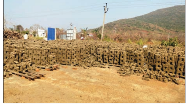
తుఫాను వల్ల నాశనమైన ఇటుక బట్టీలు

నిర్మాణ రంగంలో కాలుమోసారు. అయితే అక్కడ కూడా వారిని విధి వెక్కిరిస్తూనే ఉంది. ఇటీవల సంభవించిన తిట్లీ తుఫానుతో శ్రీకాకుళంలోని 9 మందలాల్లోని 30 గ్రామాల ప్రజలు తీవ్రంగా నష్టపోయారు. నష్టపోయిన వారిని కుమ్మరి, శాలిహాజాన సంఘం సంఘం గౌరవ అధ్యక్షుడు, ప్రధాన కార్యదర్శి, అసోసియేట్ అధ్యక్షుడు వారిని పరామర్శించగా, రాజకీయ నాయకులు, అధికారులు పట్టించుకోవడం లేదని బాధితులు వాపోయారు. దీంతో వారి పద్ద నుంచి విజ్ఞాపనలను, నష్టం అంచనాలను సేకరించి ప్రభుత్వం నుంచి సప్త పరిహారం కోసం ప్రయత్నం చేస్తున్నారు. బాధితులకు బాసటగా కులసంఘం నాయకులు, స్థానిక ఎమ్మెల్యేకు తమ బాధలు విన్నవించుకుంటే మీ బాధలు మీరు పడండి అంటూ విరుచుకుపడ్డారని కుమ్మర్లు వాపోయారు. దీనిపై రాష్ట్ర ప్రధాన కార్యదర్శి శ్రీ బెజవాడ