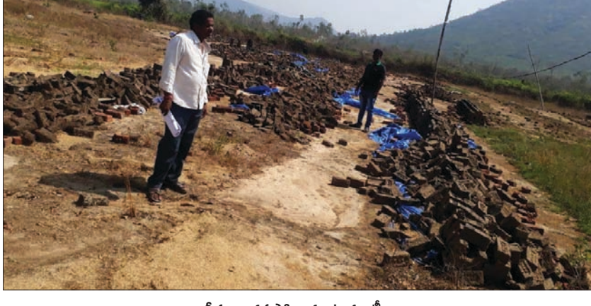
శ్రీవ్రంగా నష్టపోయిన ఇటుక బట్టీలు