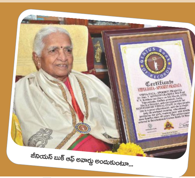
జీనియస్ బక్ ఆఫ్ లావారు అందుకుంటూ...