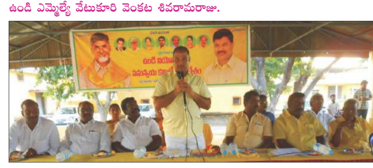
సమావేశంలో ప్రసంగిస్తున్న ఉండి ఎమ్మెల్యే శివ