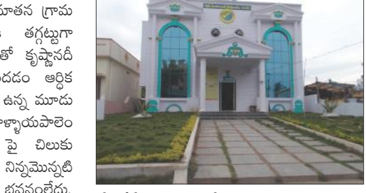
నూతనంగా నిర్మించిన మండలం పంచాయతీ కార్యాలయ భవనం

రాజధాని ప్రతినిధి-మండలం : మండలం పరిధిలోని మండలం గ్రామంలో నూతన గ్రామ పరిపాలన భవనం రాజధానికి తగ్గట్టుగా నిర్మించారు. పచ్చని పంట పొలాలలో కృష్ణానదీ తీరానికి సమీపంగా ఉండే మండలం ఆర్థిక పరిపుష్టి కలిగిన మండల పరిధిలో ఉన్న మూడు మేజర్ పంచాయతీలలో ఒకటి. తాళ్ళాయపాలెం శివారామగ్రామంగా ఉంది. 10వేల పై చిలుకు జనాభా ఉన్న మండలం గ్రామానికి నిన్నుమొస్తుల్ వరకు పంచాయతీ కార్యాలయం భవనం లేదు. గతంలో ఉన్న పంచాయతీ కార్యాలయం శిథిలావస్థకు చేరడంతో దానిని పడగొట్టి అద్దె భవనంలో గ్రామపాలన వ్యవహారాలను నిర్వహించుకుంటూ వచ్చారు. పొరుగున ఉన్న బనవోలు, మల్లారపరం లాంటి మైసర్ పంచాయతీలకు సాగిన భవనాలందాగా తాము అద్దె భవనంలో చిరులు నిర్వహించాల్సి రావడం పంచాయతీ అధికారులు, సిబ్బందితో పాటు ప్రజా ప్రతినిధులు, గ్రామస్థులకు తీవ్ర నిర్మించారు. గ్రామ సభ నిర్వహణ, సమావేశాలు, పంచాయతీ అధికారులు, సిబ్బంది బాధ్యతలు నిర్వహించేందుకు అనువుకా భవన నిర్మాణం జరిగింది.