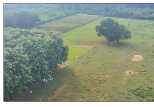
ఏపీఐఐసీకి అప్పగించనున్న భూములు

నూజివీడు : ఏపీ రాజధాని అమరావతి పరిధిలోని కృష్ణాజిల్లా నూజివీడు ప్రాంతం పారిశ్రామికీకరణకు ప్రభుత్వం కసరత్తు చేస్తోంది. ఆ దిశగా భూముల సమీకరణంలో అధికారులు నిమగ్నమయ్యారు. రాజధానికి సమీపంలో ఉండటం, అనువైన జాతీయ రహదారి, విమానాశ్రయం, పోర్టులకు అందుబాటులో ఉండటంతో సింగపూర్, జపాన్ తదితర దేశాల వ్యాపారవేత్తల దృష్టి నూజివీడుపై ఉన్నట్లు విశ్లేషణలు చేస్తుంటున్నారు. పాలకుల ఆదేశాలతో పరిశ్రమలకు కావాల్సిన భూముల సేకరణకు అధికారులు కసరత్తు ముమ్మరం చేశారు. ఇప్పటికే ఈ ప్రాంతంలో 24 వేల ఎకరాల భూ భాగాల సిద్ధం చేసినట్లు రెవెన్యూ వర్గాల సమాచారం. నూజివీడు శ్రీపుల్ బడి సమీపంలోని ప్రభుత్వ భూములను మివీ పారిశ్రామికీకరణను మినియోగింజేలా చర్యలు తీసుకోవాలంటూ అధికారులకు ఆదేశాలు రావడంతో స్థానిక సారథి ఇంజనీరింగ్ పక్కనున్న 1029, 1038, 1038 సర్వే సంబంధంలోని 32.54 ఎకరాల స్థానికానికి చర్యలు ప్రారంభించారు. ఇప్పటికే అధికారులు 10 మంది రైతులకు తమ భూములను పరిశ్రమలకు ఇవ్వనున్న నేపథ్యంలో వాటిని స్వాధీనం చేయాలని నోటీసులు అందించారు. వీటిని ఏపీఐఐసీకి ఇవ్వనున్నట్లు సమాచారం. నూజివీడు మండలం దేవరగుంట