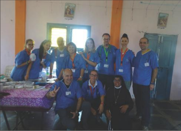
ఇంటి వైద్య బృందం