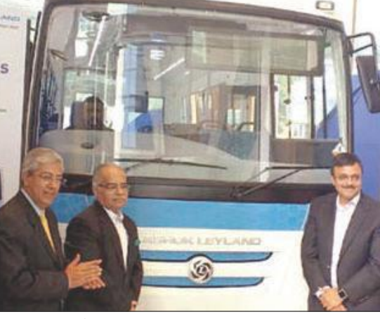
భారత్ లో రూపొందించిన మొట్టమొదటి విద్యుత్ బస్సు

అశోక్ లేల్లాండ్ సంస్థ సర్కూల్లో పేరిట పూర్తిగా భారత్ లో రూపొందించిన మొట్టమొదటి విద్యుత్ బస్సును మార్కెట్లోకి విడుదల చేసింది. ఈ బస్సు ఎటువంటి ఉద్ధారాలను విడుదల చేయరు. భారతీయ రోడ్డును... ఇతర పరిస్థితులను దృష్టిలో పెట్టుకొని దీనిని తయారు చేశామని సంస్థ తెలిపింది. ఈ సర్కూల్లో సీట్స్ బస్సును త్వరలోనే అశోక్ లేల్లాండ్ వివిధ విభాగాల్లో కూడా ప్రవేశపెట్టనుంది. లిథియం అయాన్ బ్యాటరీలతో సడిచే ఈ బస్సును ఒక్కసారి ఛార్జింగ్ చేస్తే ఏకదాటిగా 120 కిలోమీటర్లు ప్రయాణిస్తుంది. దీని ఛార్జింగ్ కు దాదాపు మూడు గంటలు పడుతుంది. ఈ బస్సులో అత్యధికంగా గంటకు 75 కిలోమీటర్లు వేగంతో ప్రయాణించవచ్చు. ఆగ్రెగ్రేషన్లను పసిగట్టే వ్యవస్థ, అడ్వాన్స్ డెటెక్టింగ్ వ్యవస్థను ఏర్పాటు చేశారు. దీనిని యూఎస్ఎస్ ఛార్జింగ్ పాయింట్లు... అన్ బోర్డ్ వైఫై ఉన్నాయి. ఈ బస్సులో మొత్తం 31 మంది ప్రయాణించవచ్చు.