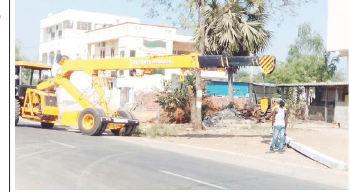
కృష్ణా పుష్కరాల ఏర్పాటులో భాగంగా కరెంటు స్థంభాలను ఏర్పాటు చేస్తున్న దృశ్యం