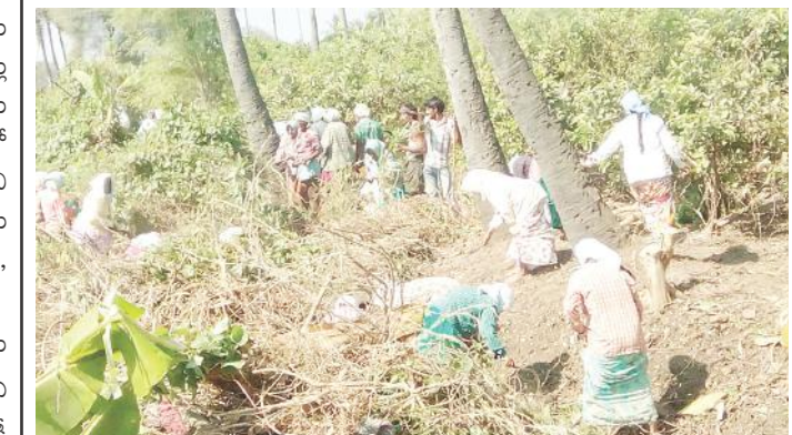
రాయపూడిలో ఉపాధి హామీ పథకంలో పనిచేస్తున్న కూలీలు