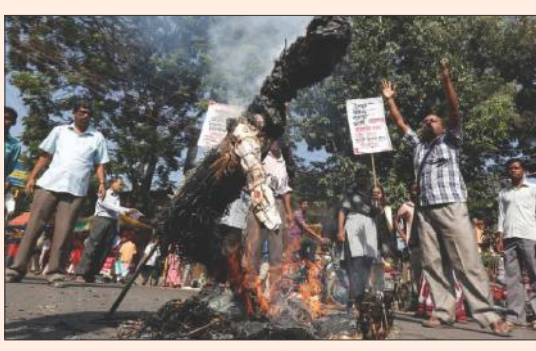
బిష్టి బొమ్మను దగ్ధం చేస్తున్న స్థానికులు