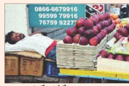
పని లేదు మని లేదు

ఎవరెన్ని ఆటంకాలు కల్పించిన సొటి మానవుడు కష్టపడుతుంటే తోడుండే వాడు సామాన్యుడే... తిండి, తిప్పలు లేకుండా క్యూలైన్లలో నిలబడిన సాధారణ పౌరులకు ఒక టీ పాపువారు టీలు అందించి సేదతీర్చితే మరొక వోట బిజ్జులు పంచి ఆకలి తీర్చారు.