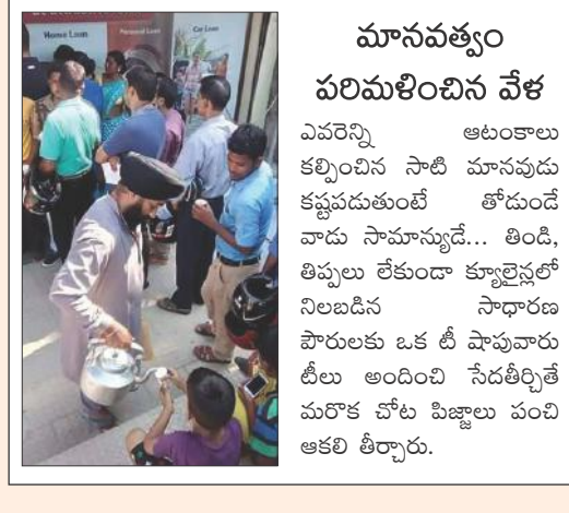
మానవత్వం పరిమళించిన వేళ

తెలియచేస్తున్నాయి. గత మూడు నెలల్లో అమాంతం బ్యాంకు డిపాజిట్లు పెరిగాయి. నల్లద్రవం ఉన్నవారు కూడా వ్యవస్థలోని అనేక లోపాల కారణంగా ఇతర మార్గాల ద్వారా పాత నోట్లను మార్చుతున్నారు. నల్లద్రవం సృష్టిస్తున్న మూలాలను ప్రభుత్వం ముట్టుకోలేదు. వార్షిక టీడీపీలో 20 శాతం నల్లద్రవం ఉంటే, అంటే ముప్పై లక్షల కోట్లకు పైగా నల్లద్రవం తయారవుతోంది. చలామణిలో ఉన్న 17.77 లక్షల కోట్లకంటే నల్ల ద్రవం శాతమే ఎక్కువ. తక్కువ విలువైన నోట్లను సరిపడనిన్ని సరఫరా చేసేందుకు నోట్లు అర్థింప వద్ద లేవు. దీంతో పాతబడి, నలిగిపోయిన బిగి బిగి పోయిన వందనోట్లను కూడా సరఫరా చేస్తున్నారు. రూ. 2000 లను తగిన సెక్యూరిటీ అంశాలు లేకుండానే ప్రభుత్వం హడావుడిగా విడుదల చేసింది. కొత్త