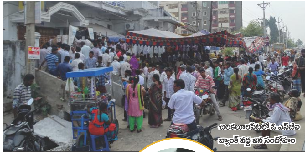
చలకలూరిపేటలో డి.ఎస్.బిఐ బ్యాంక్ వద్ద జనసందోభం