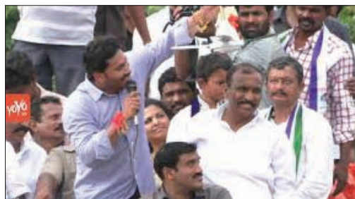
ఫ్యాన్ గుర్తుతో ప్రచారం చేస్తున్న వైఎస్ జగన్

చెందిన వ్యక్తి నాలుగున్నర లక్షల రూపాయలు పంచడానికి తీసుకు వెళుతుండగా పోలీసులు అరెస్టు చేశారని అధికార పక్షం చెబుతోంది. ఒక్కో ఓటుకు రూ.5 నుంచి 10,వేలవరకు అధికారపార్టీ అందచేసి పోలింగ్ లో పాల్గొన వద్దని