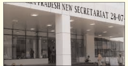
నంద్యాల ఎన్నికతో పాలన పడక

ఓటర్లను కోరుతోందని ప్రతిపక్షం విమర్శిస్తోంది. నంద్యాల ప్రజలకంటే ప్రస్తుతం ఓటర్లను ప్రసన్నం చేసుకునేందుకు వచ్చిన వివిధ సామాజిక వర్గాలతో పట్టణం నిండి పోయింది. అధికార,ప్రతిపక్షాల్లో ఒకరిపై ఒకరి నిఘా