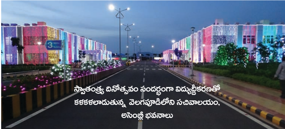
స్వాతంత్ర్య దినోత్సవం సందర్భంగా విద్యుద్దీకరణతో కళకళలాడుతున్న వెలగపూడిలోని సచివాలయం, అసెంబ్లీ భవనాలు

ఇలా మన ప్రతి పని విజయానికీ, చదువుకు, జ్ఞానానికీ దిక్కైన దేవుడు మన వినాయకుడు. ముందుగా వినాయకుడిని సంతోష పెడితే అటంకాలు రాకుండా, కష్టాలు దూరమై, సకల కార్యాలు పొంది, ఐశ్వర్యాలు సిద్ధస్థాయని ప్రజల విశ్వాసం. భాద్రపదశుద్ధ చవితినాడు వినాయకుడు జన్మించినది. అన్ని విఘ్నాలపై అధిపత్యం జరిగినట్లుగా పురాణాల బట్టి పండితుడు తెలుపుతున్నందున మన దేశంతోపాటు ఇతర దేశాలలోని వారు కూడా ప్రతి సంవత్సరము భాద్రపదశుద్ధ చవితినాడు, బంగారం, వెండి మట్టితో తయారుచేసిన ప్రతిమలకు కుటుంబ సభ్యులు అందరూ పూజించటం వల్ల మంచి ఫలితాలు అందుతాయని పురాణకథలు తెలుపుచున్నాయి. చవితిరోజున వినాయకుడు దగ్గర పండ్లు, పూలు, పత్రి అని పిలుచుకునే రకరకాల మొక్కల ఆకులు, పిండివంటలను వుంచి భక్తి శ్రద్ధలతో పూజిస్తూ ఆ దేవదేవుని గణగణాలను కీరిస్తాం, మనం మొదలుపెట్టే ప్రతిపనిలో ఎటువంటి విఘ్నాలు లేకుండా విజయం చేకూర్చాలని, జ్ఞానసిద్ధికోసం ప్రార్థిస్తాం. - తిన్నలూరి. సుధాకర్