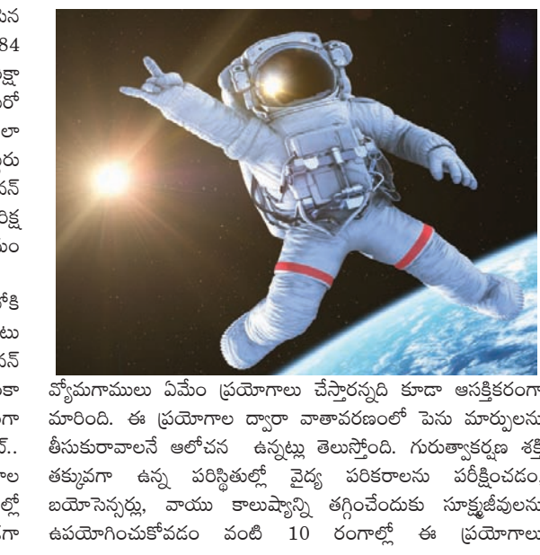
వ్యోమాగాములు ఏమేం ప్రయోగాలు చేస్తారన్నది కూడా ఆసక్తికరంగా మారింది. ఈ ప్రయోగాల ద్వారా వాతావరణంలో పెను మార్పులను తీసుకురావాలనే ఆలోచన ఉన్నట్లు తెలుస్తోంది. గురుత్వాకర్షణ శక్తి క్యాప్చూర్ చేయడంపై పాటు అనేక ఇతర డెవలప్ మెంట్లు, పరికరాల అభివృద్ధి దేశవ్యాప్తంగా ఉన్న ఇస్రో పరిశోధనకాలలో కొనసాగుతున్నాయి. ఇప్పటి ఒక ఎత్తు అయితే భూస్థిర కక్ష్యలో ఉండగా

రాజధాని వార్తలు, న్యూఢిల్లీ : అంతరిక్షంలోకి రాకేవ్ శర్యును పంపిన భారత్ త్వరలో మరో ముగ్గురిని పంపాలని ప్రయత్నిస్తోంది. 1984 ఏప్రిల్ 3న మరో ఇద్దరు రష్యన్ వ్యోమాగాములతో రాకేవ్ శర్యు అంతరిక్షానికి వెళ్లారు. అంతరిక్ష పరిశోధనలో దూసుకుపోతున్న ఇస్రో మరో ప్రతిష్టాత్మక ప్రయోగంతో ముమ్మసైల జెండాను అంతరిక్షంలో రెపరెపలాండ్ చేసుంది. గగన్ యాన్ ప్రయోగం ద్వారా అంతరిక్షంలోకి ముగ్గురు భారతీయ వ్యోమాగాములను పంపించనుంది ఇస్రో ఛీఫ్ కె శివన్ తెలిపారు. కాగా చంద్రయాన్.. మంగళయాన్ల తర్వాత భారత అంతరిక్ష పరిశోధన సంస్థ (ఇస్రో) చేపట్టిన ప్రతిష్టాత్మక అంతరిక్ష కార్యక్రమం గగన్ యాన్!