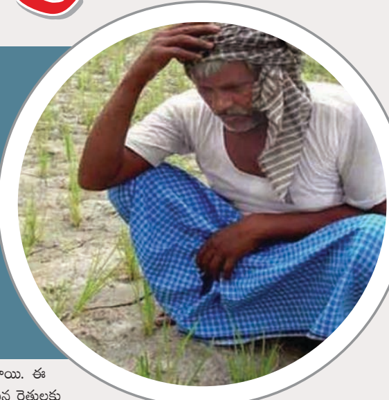
మోడీ పాలితామికవేత్తల భారీ ప్రయోజనాలను అందిస్తారని ప్రతిపక్షాలు గొంతుంచుకుంటున్నాయి. అందుకు ఉదాహరణ : 2017-18లో గ్రామీణ ఉపాధిపథకానికి రూ. 48,000 కోట్లను, అంతకు 10 రెట్లు మొత్తం రూ.1.18 లక్షలకోట్ల పాలితామిక వేత్తల మొండికలను రద్దుచేశారు.

అధికారంలోకి వచ్చింది మొదటి కార్యకర్తలకు అందునా రిలయన్స్ కు లాభం చేకూర్చేందుకే కేంద్రంలోని మోడీ సర్కార్ ప్రాధాన్యం ఇస్తోంది. ప్రాన్స్ నుంచి రాఫెల్ యుద్ధ విమానాల బహుభంగం భారత ప్రభుత్వం గంపం సంస్థ హిందూస్టాన్ ఏవియేషన్ కంపెనీని కాదని, ఏమాత్రం అనుభవంలేని అనిల్ లంబానికి చెందిన రిలయన్స్ ఏవియేషన్ కంపెనీకి రాఫెల్ యుద్ధ విమానాల తయారీని అప్పగించడంతో ప్రతిపక్షాలు పైర్ అవుతుండగా, రైతుల కోసం ప్రవేశపెట్టిన ఫసల్ బీమా యోజన (ఏఎన్ఎఫ్బీ)పథకం ద్వారా పైసా పెట్టుబడిలేకుండా వేలకొట్ల ఆదాయాన్ని పొందేందుకు అనిల్ లంబానికి మోడీ రాచబాటపరిచారని, అది రాఫెల్ కంటే పెద్దకుంభకోణమని ప్రఖ్యాత జర్నలిస్టు, పిసాయినాథ్ వెల్లడించారు. ఈనెల 2న మహారాష్ట్రలో అడవులి అవని కార్మికులకు కారణం అనిల్ ఆ వస్తువైసినరక్షణ కేంద్రం వద్ద నిర్బంధం ప్రాజెక్టుని రాజీనామా చేయమన్నారని దీని బట్టి బీజేపీకి అనిల్ గారాల పట్టిగా తెలుస్తోంది.