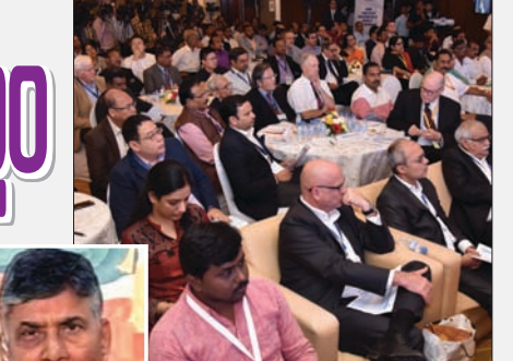
ధీల్లీలో మైక్రో సాఫ్ట్ అధినేత బిల్ గేట్స్ తో 10 నిమిషాలు సమావేశానికి అవకాశం ఇచ్చారని, దానిని నాకు గల విజన్ మేరకు సమావేశంలో 45 నిమిషాల పాటు వివిధ అంశాల వివిధం చే అవకాశం పెంచటం జరిగిందన్నారు. ఆ సమావేశంలో బిల్ గేట్స్ ఇచ్చిన హామీ మేరకు నియాటెల్ - మిగతా 3 లో

వర్క్ షాప్ లో ముఖ్యమంత్రి చంద్రబాబునాయుడు వివరించడం జరిగింది. ఈ సందర్భంగా ఆయన మాట్లాడుతూ నాలెడ్జ్ ఎకానమీ, ఇన్ ఫర్మేషన్ టెక్నాలజీ ద్వారా మార్పు సాధ్యం అవుతుందనే నమ్మకంతో 1995 వ సంవత్సరంలోనే దీనికి ప్రాముఖ్యత కల్పించానన్నారు. హైదరాబాద్ ని నాలెడ్జ్ ఎకనామిక్ గా చేయడానికి హైటెక్ సిటీని నిర్మించానని, పి.పి.పి (ప్రభుత్వ, ప్రైవేట్, పబ్లిక్ సీపీపీ) ను తీసుకువచ్చానన్నారు.