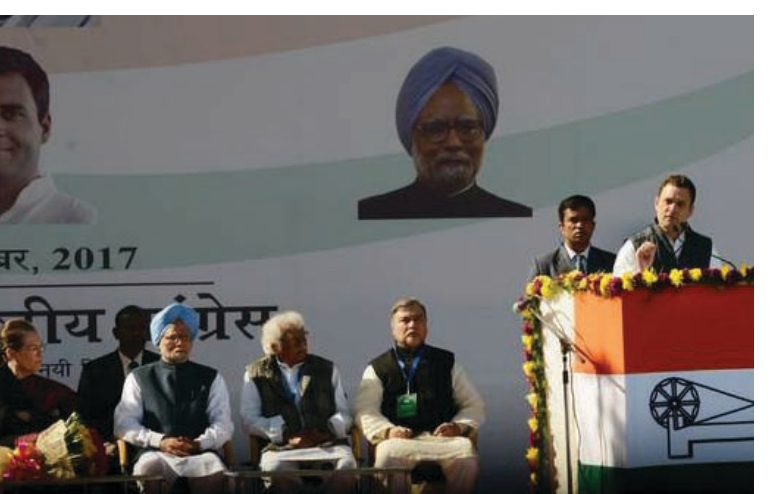
ఎన్నికైన విషయం తెలిసినట్లు, మాజీ ప్రధాని మన్మోహన్, పంజాబ్ సీఎం అమరీందర్ సింగ్ సహా పలువురు సీనియర్ నేతలు రాహుల్ ను అధ్యక్షుడిగా ప్రతిపాడిస్తూ సంతకాలు చేశారు. ఈ వేడుక సందర్భంగా విఠనీ ప్రధాన కార్యాలయంతో నెలకొంది. ఆ ప్రాంగణమంతా రాహుల్.. రాహుల్ నినాదాలతో హోరెత్తిపోయింది. టపాసులు కాలుస్తూ.. మిత్రులు పంచుకుంటూ కార్యకర్తలు సందరాలు చేసుకుంటున్నారు.