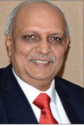
ఇవెఆర్. కృష్ణారావు, నవ్యాంధ్ర ప్రదేశ్ రాష్ట్ర ప్రభుత్వ మొదటి ప్రధాన కార్యదర్శి (జూన్ 2014- జనవరి 2016)

ప్రభుత్వం, రాజకీయనేతల తోడ్పాటుతో ప్రభుత్వ భూమిని సులభంగా తీసుకోవచ్చు. సహజ సిద్ధంగా భూమిని పొందడానికి ఒకంత ఓర్పు, పెద్దల అందందలు ఉంటే చాలు పక్కా ప్రణాళికతో ప్రభుత్వ భూమిని పొందవచ్చు. కొత్తగా ప్రభుత్వం ఏర్పడినా, రాజకీయనాయకులు మారినప్పటికీ ప్రభుత్వ భూములను పరిరక్షించలేదు. రెవెన్యూ రికార్డులను సరిగ్గా భద్రపరచలేకపోవటం వాటిపై సరైన నిఘా లేకపోవడంతో అక్రమంగా భూమిని వ్యాపారస్థులు ప్రభుత్వం నుంచి కొలగొడుతున్నారు. ఎలా అంటే ఒక డొల్ల కంపెనీ స్థాపించి అనుభవం ఉన్న చార్జెడ్ ఎకౌంటెంట్ తో ప్రాజెక్టు రిపోర్టు వ్రాయించి ప్రభుత్వానికి ఆదాయం వస్తుందని, ఉద్యోగాలు సృష్టిస్తామని చెప్పి అతి తక్కువ ధరకు భూమిని కాజేస్తున్నారు. దాదాపు ఒక కోటి ధర ఉన్న భూమిని పదిలక్షలకో లక్షల కోట్ల ప్రభుత్వం నుంచి తీసుకుంటున్నారు. కంపెనీ వనరులను పెంచుకోవాలని ఉద్యోగాలు ఇస్తున్నామని ప్రభుత్వానికి నచ్చజెప్పి ఈ భూమి పై లోను తీసుకోవేసి మెనులుటాటును ప్రభుత్వం నుండి పొందుతున్నారు. ఆ తరువాత ఇదే భూమిని మార్కెట్ ధరకు తాకట్టు పెట్టి రుణాన్ని తీసుకుంటున్నారు. కాబట్టి రూ.5 కోట్లతో దాదాపు రూ.50 కోట్లు విలువ గల భూమిని ప్రభుత్వం నుండి పొంది, దానిపై రూ.50 కోట్ల రుణాలని తీసుకుంటున్నారు. రూ.10 కోట్లు లంచాల్చినా (అధికారులకు, రాజకీయ నాయకులకు) ఏ మాత్రం చింతన లేకుండా బ్యాంకు రుణం తీసుకోగల్గుతున్నారు. ఒక వేళ తీసుకున్న రుణం వ్యాపారస్థుడు చెల్లించలేక పోతే బ్యాంకు ఆ స్థలాన్ని వేలంలో అమ్మేస్తుంది. దీంతో రెండు సార్లు, ఒకటి వ్యాపారస్థుడు చెప్పిన సంస్థ రావట్లేదు. రెండు ప్రభుత్వం దగ్గర ఉన్న భూమి రోజురోజుకు తగ్గిపోతున్నది. అధికారుల అందందలతో వ్యాపారస్థులు ఇలాంటి పెద్ద మోసాలు చేస్తున్నారు.