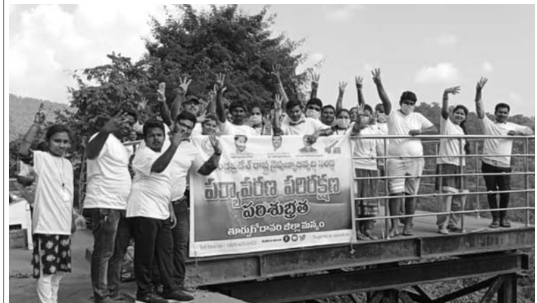
ఆంధ్రప్రదేశ్ రాష్ట్ర వైపుభూభివృద్ధి సంస్థ ఆధ్వర్యంలో పర్యావరణ, పరిరక్షణ, పరిశుభ్రత గురించి తూర్పుగోదావరి జిల్లాలో పర్యటించిన వాలంటీర్లు.