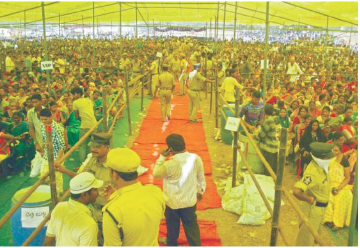
సభలో పోలీసుల హడావుడి

అన్నంరెడ్డి సుబ్బారావు - రాజధాని ప్రతినిధి - కొయ్యలగూడెం పోలవరం ప్రాజెక్టు నిర్మాణంతో ముంపునకు గురయ్యే గ్రామాల ప్రజలకు, రైతులకు కొత్త భూసేకరణ చట్ట ప్రకారం పరిహారం చెల్లించడం జరుగుతుందని, ఇళ్లు నిర్మిస్తామని, 5 లక్షల రూపాయలు చెల్లిస్తామని, నిర్వాసితుల పిల్లలకు చదువు భవిష్యత్ బాధ్యత తాను అడుకుంటానని ముఖ్యమంత్రి చంద్రబాబునాయుడు వరాలు ప్రకటించారు. తెలంగాణ రాష్ట్రం ఖమ్మం జిల్లా నుంచి పల్నాడు గోదావరి జిల్లాలో విలీనమైన కుకునూరు, వేలేరుపాడు మండలాలకు చెందిన పోలవరం ప్రాజెక్టు ముంపు నిర్వాసితులకు భరోసా కల్పించడం కోసం ఈ నెల 13వ తేదీ కుకునూరు మండలం మారేడుమాక గ్రామంలో నిర్వహించిన బహిరంగ సభలో ముఖ్యమంత్రి ప్రసంగించారు. ప్రాజెక్టు ముంపునకు సంబంధించి మొదట్లో భూములు ఇచ్చి అనాడే పాతచట్ట ప్రకారం ఎకరానికి రూ.1.15 లక్షలు పరిహారం అందుకున్న వారికి మాత్రం కొత్త భూసేకరణ చట్టం ప్రకారం ఇప్పుడు అదనంగా ఏమీ ఇవ్వలేమని, వారికి కొత్త చట్టం వర్తించదని ముఖ్యమంత్రి తన ప్రసంగంలో కుండబద్దలు కొట్టినట్లు స్పష్టం చేయడం సభలోని నిర్వాసితులను నిరాశపరిచింది. అసంతృప్తి కలిగించింది. ప్రాజెక్టు నిర్మాణం కోసం తమ గ్రామాలను, జీవనాధారమైన వ్యవసాయ భూములను, నివాస గృహాలను, పడులుకొన్న రైతులు, ప్రజల త్యాగాలను ఎన్నటికీ మరువలేమని, వారి త్యాగానికి సరైన రీతిలోనే న్యాయం చేస్తామని చంద్రబాబు చెప్పారు. నిర్వాసితులకు మునుపటి ఆర్థిక పరిస్థితికన్నా మెరుగైన జీవన ప్రమాణాలు పెరిగి విధంగా చూస్తానని