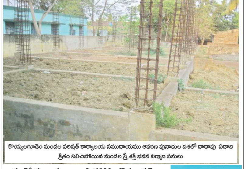
కొయ్యలగూడెం మండల వలిషేత్ కావ్యాలయ సముదాయము అవరణ పునాదుల దశలో దాదాపు ఏడాది క్రితం నిలిచిపోయిన మండల స్రీ శక్తి భవన నిర్మాణ పనులు