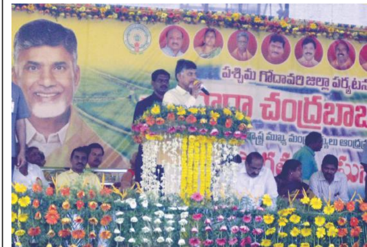
కుకునూరు బహిరంగ సభలో సి.ఎం. చంద్రబాబు ప్రసంగిస్తున్న దృశ్యం