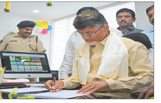
తన కార్యాలయంలో మొదటి సంతకం చేస్తున్న సీఎం చంద్రబాబు

భారీ పేలేడు పదార్థాలతో దాడి చేసినప్పటికీ చెక్కు చెదరని విధంగా కాంట్రీటు గోడలను నిర్మించారు. మంత్రివర్గ సమావేశమందడంతో పాటు ప్రముఖులతో సమావేశమయ్యే గది, భోజనశాల తదితరాలను ఇటాలియన్ మార్బుల్స్ తో అందంగా తీర్చిదిద్దారు. నిజాన్ భాగంగా కార్యాలయంలో అడగడగునా సీసీ కెమెరాలను అమర్చారు. ముఖ్యమంత్రి సూచనల మేరకు అంతర్గత అందాలకు మెరుగులు దిద్దారు. భవనం మొత్తం 72/70 మీటర్ల నిష్పత్తిలో 50వేల చదరపు అడుగుల్లో నిర్మించారు. ఒక్కో భవనంలో రెండు అంతస్తులు కలిపి లక్ష చదరపు అడుగుల మేర స్థలం వచ్చే విధంగా నిర్మాణంలో జాగ్రత్తలు తీసుకున్నారు. వెలగపూడిలో మొత్తం ఆరుభవనాల సమదాయంగా తాత్కాలిక సచివాలయం నిర్మిస్తున్న విషయం తెలిసింది. ఇప్పటికే నాగార్ భవనాలు అందజాటులోకి