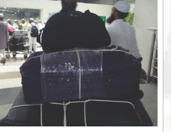
హజీ తయ్యబ్ ఖాన్