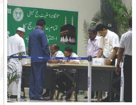
పవిత్ర జలం జలాన్ని పంపిణీ చేస్తున్న విమానాశ్రయ సిబ్బంది

హైదరాబాద్ : రాష్ట్రం క్షిప్రపరిస్థితుల్లో ఉంది గనుక ఖర్చులు తగ్గించుకోవాలి అని పదేపదే ఉపన్యాసాలు దంచుతున్న ముఖ్యమంత్రి చంద్రబాబు చెప్పిన మాటలకు చేస్తున్న పనులకు పొంతన లేదని మాజీ మంత్రి వైకాపా నేత పార్థసారథి అన్నారు. సీఎం విప్లవివేది ఖర్చులతో రాష్ట్ర ఖజానాను గుల్లచేస్తున్నారని విమర్శించారు. పార్టీ కార్యాలయంలో ఏర్పాటు చేసిన మీడియా సమావేశంలో ఆయన మాట్లాడుతూ రాజధాని నిర్మాణం పూర్తియ్యే వరకూ చెట్టుకింద పాలన సాగిస్తామన్న చంద్రబాబు ఇప్పుడు సచివాలయ నిర్మాణానికి అంచనా వ్యయం అమాంతం పెంచేస్తున్నారన్నారు. సీఎం క్యాంపు కార్యాలయానికి బిల్డింగ్ ఫ్రూఫ్ అడ్డంగా, రాకెట్ దాడులు నుంచి రక్షణకోసం శత్రుదర్శిన్లుగా చేయడానికి అంటూ రెండు సార్లు దొంగసంతకాలు చేయాలా అని ఆగ్రహం వెలిబుచ్చారు. ఎన్నికల్లో గెలిచిన తరువాత పదేళ్లపాటు హైదరాబాద్ నేనే ఉంటానని చెప్పిన చంద్రబాబు రెండేళ్లకే ఎందుకుపలాయనం చిత్తగించారో ప్రజలకు చెప్పాలన్నారు. ఓటుకు కోట్లు కేసులో దొరికిపోయాక చంద్రబాబు అమరావతి పల్లకి అందుకున్నారన్నారు. ఐటికి తమ పార్టీ అధినేత జగన్మోహన్ రెడ్డి పదివేల కోట్లరూపాయలు చెల్లించారంటూ అసత్యప్రచారాలు చేస్తున్నారన్నారు. చంద్రబాబు దగ్గర ఆధారాలు ఉంటే బయట పెట్టాలని డిమాండ్ చేశారు. కేంద్రంలో తాము అధికారంలో ఉన్న ప్రభుత్వంతో విచారణ జరిపించి ఆధారాలతో బయట పెట్టాలని, లేకుంటే చంద్రబాబు ప్రజలకు బహిరంగ క్షమాపణలు చెప్పాలని డిమాండ్ చేశారు. ముఖ్యమంత్రి స్థానంలో ఉన్న వ్యక్తి ఆసత్య ప్రచారాలు చేయటం, కేంద్ర ప్రభుత్వ ఆధీనంలో పనిచేస్తున్న అసత్య ప్రచారం నియమ నిబంధనలు ఉల్లంఘించటం సిగ్గుచేటువచ్చారు. ముఖ్యమంత్రి హుందాగా వ్యవహరించి నలుగురికీ మార్గదర్శకంగా నిలవాలని పార్థసారథి సూచించారు.