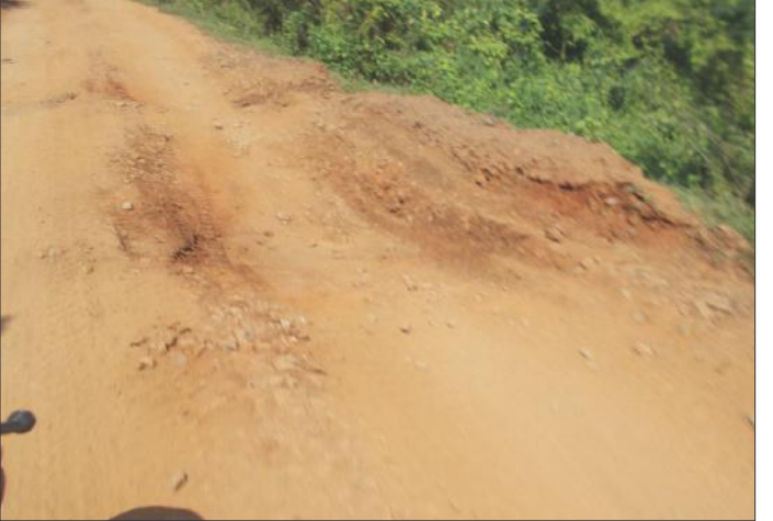
గుంతల మయంగా మారిన కరకట్ట రోడ్డు

రాజధాని ప్రతినిధి, తుళ్లూరు : కృష్ణానది కరకట్ట గోతులు మయంగా మారింది. గజానికో గొయ్యి, అడుగుకో గుంత చదంగా తయారై రాకపోకలకు ఇబ్బందికరంగా మారింది. రాజధాని నిర్మాణం సేవార్థం విజయవాడలోని కృష్ణా బ్యారేజీ దగ్గర నుంచి ఉద్ధృతం చేయాలని కరకట్ట రోడ్డు ప్రభుత్వం అభిప్రాయపడింది. లింగాయపాలెం దగ్గర నుంచి హరిశ్చంద్రవరం వరకు కరకట్ట రోడ్డు గుంతల మయంగా మారినప్పటికీ అభివృద్ధి చేయటం వదిలేశారు. అభివృద్ధి చేయాలి లేదా లేదా నుంచి వందలాది లాట్లు, ట్రాక్టర్ల కరకట్ట రావడంపై రాకపోకలు సాగిస్తుండటంతో రోడ్డు గుంతల మయంగా మారింది. ప్రభుత్వం స్పందించి కరకట్ట రోడ్డును తక్షణం అభివృద్ధి చేయాలని ప్రజలు కోరుతున్నారు.