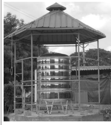
ఎన్టీఆర్ సుజల పథకం కింద రాయపూడి లో నిర్మాణంలో ఉన్న మంచినీటి ట్యాంక్