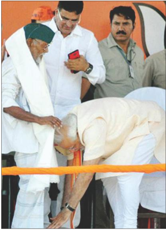
కల్లల్ షేక్ నిజాముద్దీన్ కాళ్లకు నమస్కరిస్తున్న ప్రధాన మంత్రి నరేంద్ర మోడీ (డైలీ)

1943లో బర్మా యుద్ధక్షేత్రంలో బ్రిటిష్ సైన్యాలతో పోరాడు తుండగా, చెట్ల పొదల నుండి ఒక తుపాకీ గొట్టం సుభాష్ కు గురిపెట్టబడి ఉండడాన్ని షేక్ నిజాముద్దీన్ గమనించి, తక్షణమే నేతాజీ ముందుకు దూకి ఆయనకు అడ్డుగా నిలిచారు. ఈలోగా శత్రువు తుపాకీ పేల్చడంతో మూడు బుల్లెట్లు షేక్ నిజాముద్దీన్ ను గాయపడ్డాయి. ఆయన శరీరంలోని బుల్లెట్లు కెప్టెన్ లక్ష్మీ సెహగల్