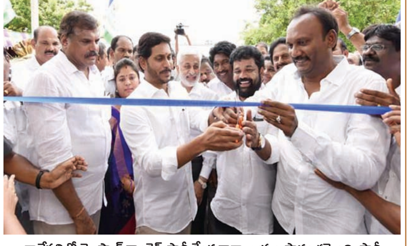
తాడేపల్లిలో వైఎస్సార్ కాంగ్రెస్ పార్టీ తీవ్ర కార్యాలయం ప్రారంభమైంది. పార్టీ అధ్యక్షుడు, ముఖ్యమంత్రి వైఎస్ జగన్మోహన్ రెడ్డి చేతుల మీదుగా శనివారం ఉదయం నూతన కార్యాలయం ప్రారంభోత్సవం జరిగింది.