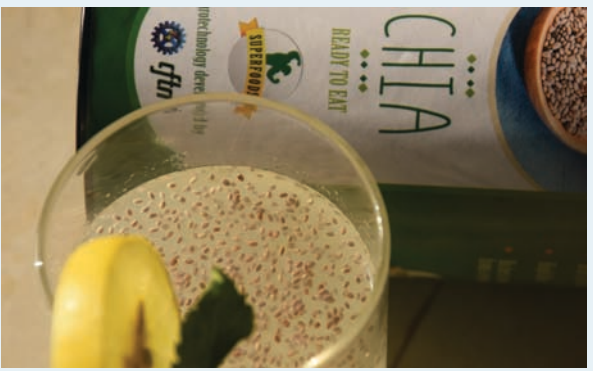
కొన్ని శతాబ్దాలుగా యుద్ధాలతో ప్రజలు వలసల బాటపట్టడంతో ఆహారంలో అధిక ప్రాధాన్యతనిచ్చే చియా గింజలు తమ ప్రభావాన్ని