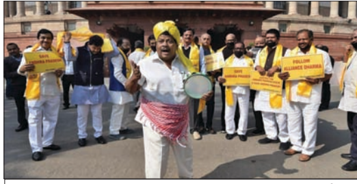
పార్లమెంట్ వద్ద ప్రకటన చేస్తున్న ఆంధ్రా ఎంపీలు

అమరావతి : విభజన హామీలు వెంటనే అమలు చేయాలని.. ఆంధ్రప్రదేశ్కు ప్రత్యేక ప్యాకేజీ ఇవ్వాలని గత కొన్ని రోజులుగా పార్లమెంట్లో వేదికగా రాష్ట్ర ఎంపీలు గళమెత్తిన విషయం తెలిసింది. ఇటీవల ప్రవేశపెట్టిన కేంద్ర బడ్జెట్లో ఆంధ్రా పూసెక్టర్ పోషకం ఏపీ తీవ్రంగా నిరాశ చెందింది. దీంతో తమ డిమాండ్లను నెరవేర్చాలంటూ పార్లమెంట్లో ఆంధ్రా ఎంపీలు నిరసనకు దిగారు. పావనం ప్రాజెక్టుకు నిధులు సమకూర్చడంతో పాటు.. విశాఖ రైల్వే జోన్ ప్రకటించాలని డిమాండ్ చేస్తున్నారు. అయితే విశాఖ రైల్వే జోన్పై మాత్రం కేంద్రం స్పందించకపోవడం గమనార్హం.