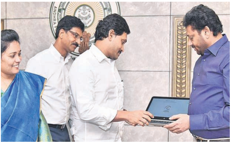
నవనాటిలో కనెక్ట్ టు ఆంధ్రా వెబ్ పోర్టల్ను అభివృద్ధిచేసిన ముఖ్యమంత్రి వైయస్. జగన్మోహన్ రెడ్డి

రాజధాని వార్తలు, అమరావతి : 'కనెక్ట్ టు ఆంధ్రా' కింద రాష్ట్రంపై ఉన్న ప్రేమాభిమానాలు చాలాని ప్రవాసాంధ్రులకు ముఖ్యమంత్రి వైఎస్ జగన్మోహన్ రెడ్డి పిలుపునిచ్చారు. సచివాలయం లోని తన కార్యాలయంలో కనెక్ట్ టు ఆంధ్రా వెబ్ పోర్టల్ను ఆయన అభివృద్ధిచేశారు. కార్పొరేట్ జగన్మోహన్ రెడ్డి కింద నిధులు, అలాగే దాతలు, సంస్థలు, ప్రవాసాంధ్రుల నుంచి వచ్చే సాయం కోసం ప్రత్యేకంగా ఈ వెబ్ పోర్టల్ను రూపొందించారు. కనెక్ట్ టు ఆంధ్రాకు ముఖ్యమంత్రి చైర్మన్ గా, సీఎస్ వైస్ చైర్మన్ గా వ్యవహరిస్తారు. ఈ సందర్భంగా సీఎం వైఎస్ జగన్మోహన్ రెడ్డి మాట్లాడుతూ ప్రభుత్వ పథకాలు, కార్యక్రమాల్లో భాగస్వాములు కావాలని ప్రవాసాంధ్రులకు పిలుపునిచ్చారు. సొంత గ్రామంలో అమలుతున్న సవరణలూ,