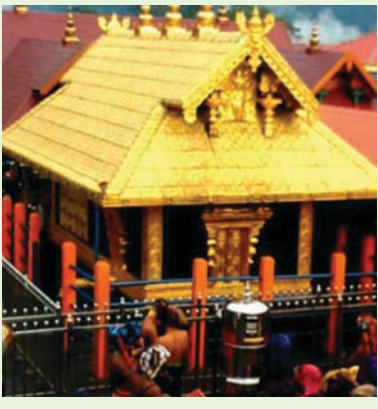
వెల్లడికానుంది. అయిదు అలయంలోకి 10 నుంచి 45 ఏళ్ల లోపు మహిళలకు ప్రవేశం నిషేధం. దీనిపై మహిళా హక్కుల కార్యకర్తలు దాఖలుచేసిన పిటిషన్లను విచారించిన ఐదుగురు సభ్యుల ధర్మాసనం 4-1తో వారికి అనుకూలంగా

రాజధాని వార్తలు, న్యూఢిల్లీ : దేశంలో కీలక మార్పులకు నాంది పలికే మూడు తీర్పులను సుప్రీంకోర్టు వెలువరించనుంది. శబరిమలలో అన్ని వయస్సుల మహిళలకు ప్రవేశం, రాఫేల్ యుద్ధ విమానాలు, సీబీఐ అధికారుల మధ్య వివాదం కేసుల్లో తీర్పులను సుప్రీంకోర్టు ప్రధాన న్యాయమూర్తి జస్టిన్ రంజన్ గోగాయ్ వెలువరించనున్నారు. శబరిమల అయిదు అలయంలోకి అన్ని వయస్సుల మహిళలకు ప్రవేశం కల్పిస్తూ గతేడాది ఫిబ్రవరి 6న ఐదుగురు న్యాయమూర్తుల రాజ్యాంగ ధర్మాసనం ఇచ్చిన తీర్పుపై రిఫ్రష్ పిటిషన్ దాఖలైంది. దీనిపై కూడా విచారణ పూర్తిచేసిన త్రిసభ్య ధర్మాసనం తీర్పును రిజర్వ్ చేసింది. ఈ కేసులో తీర్పును వచ్చే వారం సర్వోన్నత న్యాయస్థానం వెల్లడించనుంది. రాఫేల్ యుద్ధ విమానాల కొనుగోట్టు, సీబీఐ డైరెక్టర్ మధ్య వివాదంపై కూడా తీర్పు