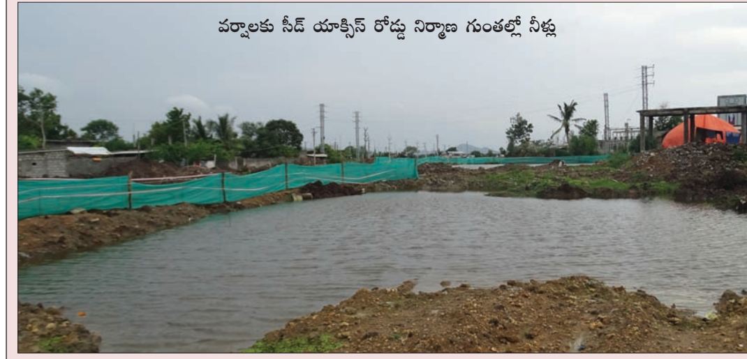
వర్షాలకు నీడ యాక్సిస్ రోడ్డు నిర్మాణ గుంతల్లో నీళ్లు