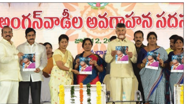
అంగన్వాడీల అవగాహన సదస్సు

రాజధాని వార్తలు ప్రతినిధి, అమరావతి : 'ఈజ్ ఆఫ్ దూయింగ్ బిజినెస్'లో మొదటిస్థానంలో ఉన్నామని, శాశ్వతంగా మనమే తొలిస్థానంలో ఉంటామని ముఖ్యమంత్రి చంద్రబాబు స్పష్టం చేశారు. వేతనాలు పెంచినందుకు చంద్రబాబును అంగన్వాడీ, ఆశావర్షం గురువారం సన్మానించారు. ఈ సందర్భంగా సీఎం మాట్లాడుతూ అంగన్వాడీలు, ఆశా వర్షం సంఘటితం కావాలని అన్నారు. శాశ్వత అంగన్వాడీ భవనాలు నిర్మిస్తున్నామని తెలిపారు. అంగన్వాడీలు, ఆశా వర్షంకు చంద్రబాబు వర్తమానం సీఎం ప్రకటించారు. అగస్టు 15లోపు అంగన్వాడీ, ఆశా వర్షంకు సెల్ ఫోన్లు ఇస్తామన్నారు. కేంద్రం సహకరించకపోయినా నిలదొక్కుకునే శక్తి వచ్చిందంటే కారణం ప్రజల సహకారమే అని సీఎం వెల్లడించారు. అంగన్వాడీలకు చంద్రబాబు వరాలు అంగన్వాడీల అవగాహన సదస్సులో గురువారం సీఎం చంద్రబాబు పాల్గొని మాట్లాడుతూ తల్లివద్దల్లో పోషకాహార లోపం, రక్తహీనత నివారించేందుకు అంగన్వాడీలు కృషి చేయాలన్నారు. అగస్టు 15 నాటికి అంగన్వాడీ టీచర్లందరికీ సెల్ ఫోన్లు అందజేస్తామని హామీ ఇచ్చారు. బనీషన్ రికార్డుల్ని సీఎం ఆఫ్ ద్వారా ఆన్ లైన్ లోనే సమూహం చేసుకునే వెసులుబాటు కల్పిస్తున్నామన్నారు. ప్రభుత్వ