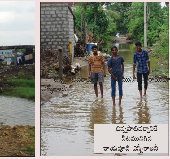
చిన్నపాటివరసానికే నీట మునిగిన రాయపూడి ఎస్సీకాలనీ