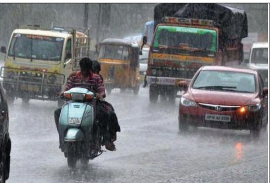
నారామళ్లకు తీవ్రమైన నష్టం ఏర్పడింది. ముప్పనూరు దిగక బయటకు పంపేందుకు రైతులు పడుతున్న అపస్వలు అస్పష్టమై కావు. మరోవైపు లోతట్టు ప్రాంతాలు కాకుండా మాగానిలో మెరకప్రాంత ఆయకట్టులో భరిష్ నాట్లు పడుతున్నాయి. వర్షాల కారణంగా ఈ పనులు వేగంగా ముందుకు సాగడం లేదు. ఇప్పటికే భరిష్ సీజన్ 20 రోజుల పైబడి వృధా అయిపోయింది. ఈ ప్రభావం పంట చేతికొచ్చే సమయంపై పడుతుందని రైతులు కలవరపాటుకు గురవుతున్నారు.

రాజధాని వార్తలు, అమరావతి : రాష్ట్రంలోని పలు జిల్లాల్లో భారీ వర్షాలు కురుస్తున్నాయి. ముఖ్యంగా కోస్తాంధ్రలోని ఉభయగోదావరి, కృష్ణా జిల్లాల్లో కుండపోత వర్షాలు కురుస్తున్నాయి. దీంతో వాగులు, వంకలు పొంగిపొర్లుతున్నాయి. ఎగువ ప్రాంతాల నుంచి వస్తున్న వరద నీటికి తోడు భారీ వర్షాల కారణంగా గోదావరి నది నీటి మట్టం పెరుగుతోంది. దీంతో లంక గ్రామాల ప్రజలకు కష్టాలు మొదలయ్యాయి. తూర్పుగోదావరి జిల్లాలో పది రోజులుగా వర్షాలు కురుస్తూనే ఉన్నాయి. ముఖ్యంగా కోనసీమ ప్రాంతాలు భారీ వర్షాలతో తడిసి ముద్దవుతోంది. కృష్ణా జిల్లా అంతటా విస్తారంగా వర్షాలు కురుస్తున్నాయి. నిన్న రాత్రి నుంచి ముసురువానలో వాతావరణంలో ఉష్ణోగ్రతలు బాగా తగ్గాయి. ఈదురుగాలులతో పలు చోట్ల విద్యుత్ సరఫరాకు అంతరాయం ఏర్పడింది. రోడ్లపై వర్షపు నీరు పచ్చి చేరడంతో వాహనదారులు తీవ్ర ఇబ్బందులకు గురవుతున్నారు. అత్తిలి, ఉండ్రాజువరం, తణుకు, ఇరగవరం మండలాలలో చంటలు నీట మునిగాయి. భారీ వర్షాలతో పలు గ్రామాలకు విద్యుత్ సరఫరా నిలిచిపోయింది. ఇక పోలవరం ప్రాజెక్టు వద్ద గోదావరి వరద అంతంతకూ పెరుగుతోంది. వరద ఉధృత మరంత పెరిగితే స్విల్చే పనులు నిలిచే అవకాశం ఉందని అధికారులు చెబుతున్నారు. వరద నీరు అధికంగా ఉండటంతో వారం క్రితమే కాపర్ డ్యామ్ పనులు నిలిచిపోయాయి. కోనసీమలో భారీ వర్షాల నారామళ్లకు తీవ్రమైన నష్టం ఏర్పడింది. ముప్పనూరు దిగక