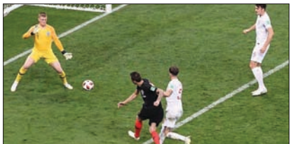
లక్షలు. అంటే మన దేశంలో మిజోరాం-నాగాలాండ్ ఈ రెండు రాష్ట్రాలను కలిపితే ఉన్న జనాభా కంటే క్రాయ్షియా దేశ జనాభానే తక్కువ. ఒక్క హిమాచల్ ప్రదేశ్ (68.6 లక్షలు) రాష్ట్రంతో పోలి మూసినా క్రాయ్షియా జనాభా తక్కువే. దీంతో 1950లో వరల్డ్ కప్ ఫైనల్ చేరిన చిన్న దేశంగా ఉరుగ్న చరిత్ర సృష్టించింది. 68 ఏళ్ల తర్వాత ఫైనల్ కు చేరిన చిన్న దేశం ఆ తర్వాత అంటే 68 ఏళ్ల తర్వాత 2018 ఫిఫా వరల్డ్ కప్

సంబరాలలో ప్రజలు హైదరాబాద్ : రష్యాలో జరుగుతున్న ఫిఫా వరల్డ్ కప్ లో గురువారం లుక్సిక్ స్టేడియంలో జరిగిన రెండో సెమీఫైనల్లో ఇంగ్లాండ్ పై 2-1 తేడాతో గెలిచి తొలిసారిగా ఫైనల్ కు చేరింది. దీంతో వరల్డ్ కప్ ఫైనల్లో తలపడే రెండు జట్లు ఏవో తెలిసిపోయింది. జెర్మీయంతో జరిగిన తొలి సెమీఫైనల్లో ఫ్రాన్స్ విజయం సాధించగా, ఇంగ్లాండ్ తో జరిగిన రెండో సెమీఫైనల్లో క్రాయ్షియా విజయం సాధించి మ్యాచ్ లోని లుక్సిక్ స్టేడియంలో వరల్డ్ కప్ ఫైనల్ పోరుకు సిద్ధమయ్యాయి. 1998 వరల్డ్ కప్ లో సెమీఫైనల్ చేరుకోవడమే క్రాయ్షియా జట్టు అత్యుత్తమ ప్రదర్శన కావడం విశేషం. దీంతో ఫిఫా వరల్డ్ కప్ ఫైనల్ చేరిన చిన్నదేశంగా (జనాభా పరంగా) క్రాయ్షియా నిలిచింది. క్రాయ్షియా జనాభా సుమారు నలభై లక్షలు. అంటే మన దేశంలో మిజోరాం-నాగాలాండ్ ఈ రెండు రాష్ట్రాలను కలిపితే ఉన్న జనాభా కంటే క్రాయ్షియా దేశ జనాభానే తక్కువ. ఒక్క హిమాచల్ ప్రదేశ్ (68.6 లక్షలు) రాష్ట్రంతో పోలి మూసినా క్రాయ్షియా జనాభా తక్కువే. దీంతో 1950లో వరల్డ్ కప్ ఫైనల్ చేరిన చిన్న దేశంగా ఉరుగ్న చరిత్ర సృష్టించింది. 68 ఏళ్ల తర్వాత ఫైనల్ కు చేరిన చిన్న దేశం ఆ తర్వాత అంటే 68 ఏళ్ల తర్వాత 2018 ఫిఫా వరల్డ్ కప్ - మిగతా 2 లో