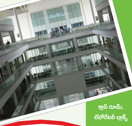
కాన్ గ్రూమ్, లేబోరేటరీ బ్లాక్స్