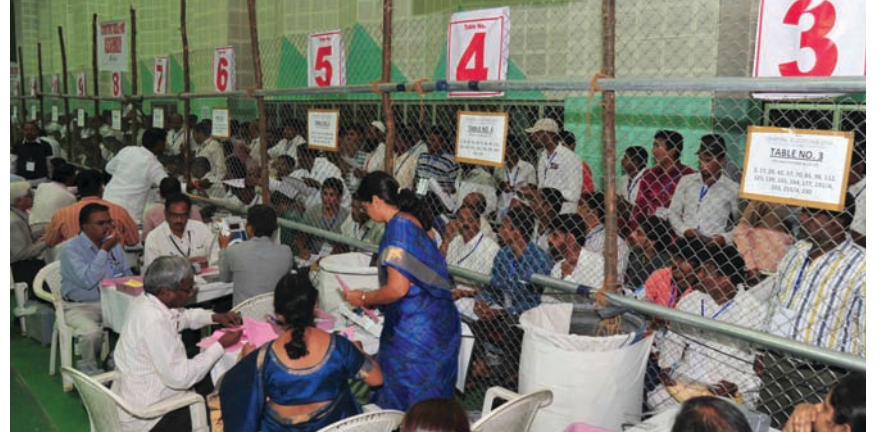
2014 లసెంజ్లె ఎన్నికల కొంటింగ్ జరుగుతున్న దృశ్యం (ఢిల్లీ)