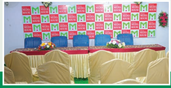
విజయవాడ బందర్ రోడ్డులో ఆధునిక సౌకర్యాలతో మీడింగ్ హాలు ఏర్పాటు చేయడం జరిగింది. ఇందులో 50 మందితో సమావేశాలు జరుపుకోవచ్చును. ఫోన్: 94406 62699