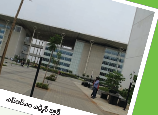
ఎన్ఆర్ఎం ఎడ్మిన్ బ్లాక్