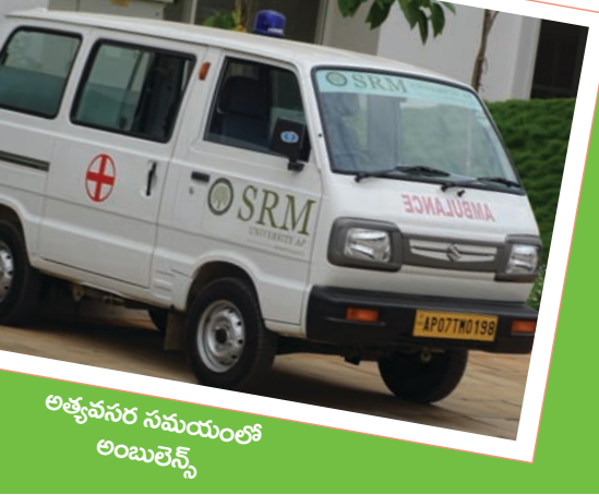
అత్యవసర సమయంలో అంబులెన్స్