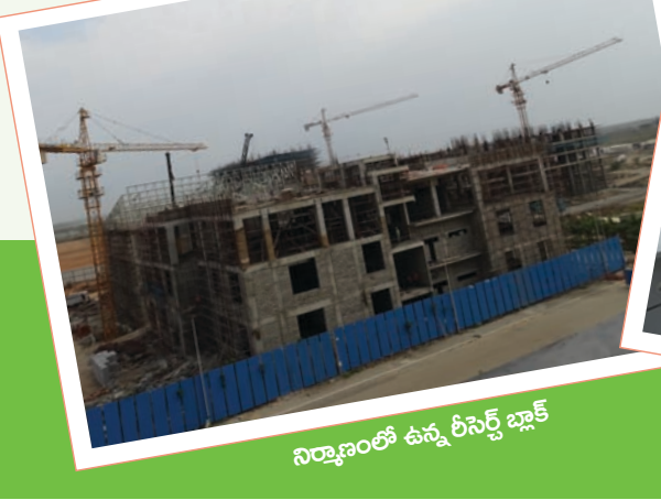
నిర్మాణంలో ఉన్న రీసెర్చ్ బ్లాక్