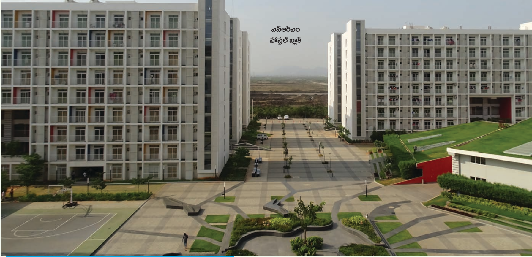
ఎన్ఆర్ఎం హాస్టల్ బ్లాక్