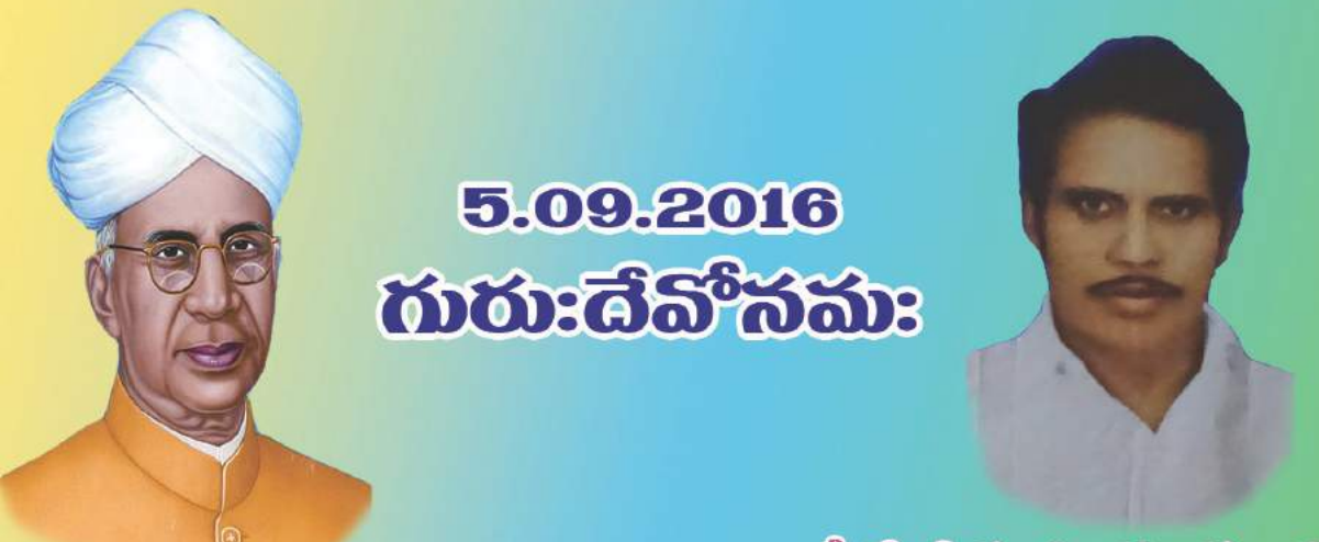
డా|| సర్వేపల్లి రాధాకృష్ణన్ (మాజీ రాష్ట్రపతి) ఆదర్శ గురువర్ణులు