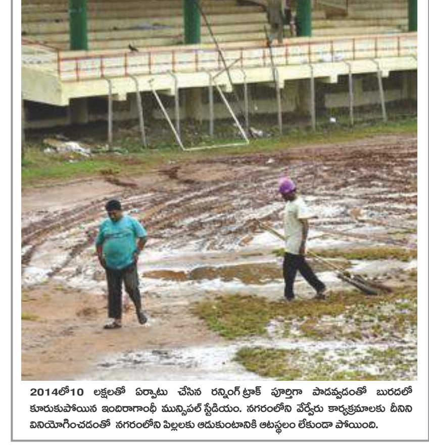
2014లో 10 లక్షలతో ఏర్పాటు చేసిన రంగ్ గోల్ ట్రాక్ పూర్తిగా పాడవుడంతో బురదలో కూరుకుపోయిన ఇందిరాగాంధీ మున్సిపల్ స్టేడియం. నగరంలోని వేర్వేరు కార్యక్రమాలకు దీనిని వినియోగించడంతో నగరంలోని పిల్లలకు ఆడుకుంటానికి అటవీలం లేకుండా పోయింది.