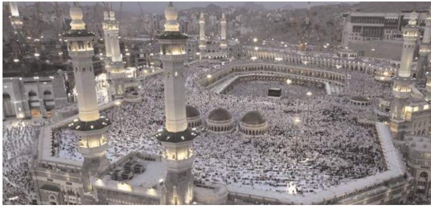
మక్కాలోని అల్ మసజిద్ అల్ హరాం

రాజధాని ప్రతినిధి - తుళ్లూరు : రాజధాని ప్రాంతంలోని ముస్లింలు మొదటి సారిగా హజ్ యాత్రకు తరలివెళ్ళారు. జీవితంలో ఒక్కసారిగా కాకపోయినా విశ్వేశ్వరస్వామి సమేత విశ్వేశ్వరుణ్ణి దర్శించుకోవాలని హిందువులు ఎలా అనుకుంటారో అలాగే ప్రతి ముస్లిం సౌదీ అరేబియాలోని మక్కానుండి దర్శించుకోవాలని ఆరాటపడుతుంటారు. ఖురాన్ లోని నిబంధన ప్రకారం దేవునిపై విశ్వాసం ఉంచాలి, బదుపూర్వ నమాజ్ చేయడం రంజాన్ మాసంలో ఉపవాసం ఉండటం, సంపాదించిన దాంట్లో(జకాత్) 2.5% పేదలకు దానధర్యాల చేయడం, వెళ్లగలిగిన ముస్లిం తప్పనిసరిగా ఒకసారి హజ్ కు వెళ్లటం ముఖ్యం. అయితే అప్పుచేసి యాత్ర చేయకూడదు. అలాగే ఎవరికి అప్పు ఉండకూడదు. ఎవరితో గొడవలు పడకూడదు, ఇదివరకు గొడవపడి ఉన్నట్లయితే వారిని క్షమించమని అడగాలి.