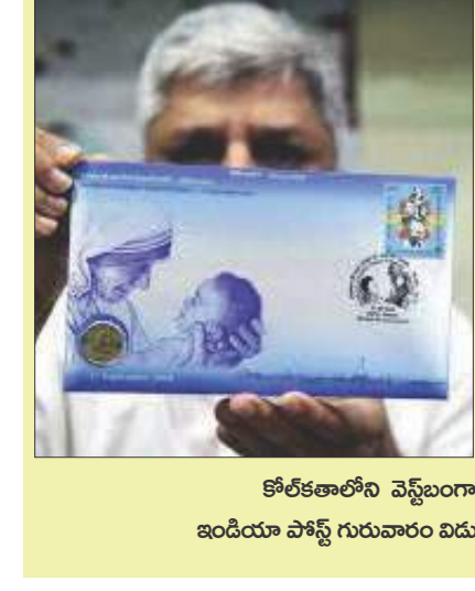
కోల్ కతాలోని వెస్ట్ బంగాల్ సర్కార్ మదర్ థెరిసా సైని ఇండియా పోస్ట్ గురువారం విడుదల చేసిన పోస్టల్ కవర్, నాణెం