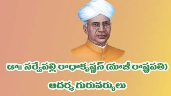
డా|| సర్వేపల్లి రాధాకృష్ణన్ (మాజీ రాష్ట్రపతి) ఆదర్శ గురువర్ణులు