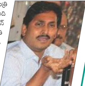
వైఎస్ జగన్ మోహన్ రెడ్డి

రాజధాని ప్రతినిధి - కడప : ముఖ్యమంత్రి చంద్రబాబుకు ఏమైనా చిత్రశుద్ధి ఉందంటే అది ఓటుకు కోట్లు కేసులోనే అని ప్రతిపక్ష నేత వైఎస్ జగన్ మోహన్ రెడ్డి ఎద్దేవా చేశారు. ఒక ముఖ్యమంత్రి రెడ్ హ్యాండెడ్ గా ఆడియో, వీడియో టేపుల్లో పట్టుబడి అరెస్టు కాకపోవడం బహుశా దేశ చరిత్రలోనే కాదు, ప్రపంచ చరిత్రలో ఈయనాకర్తేనే మోసాని విమర్శించారు. ఇంతలా మేనేజ్ చేయగల సమర్థుడు చంద్రబాబుని స్పష్టం చేశారు. వైఎస్సార్ జిల్లా వేంపల్లె మండలం ఇడుపులపాయలో దివంగత సీఎం వైఎస్ రాజశేఖరరెడ్డి ఏడో వర్సెటి కార్యక్రమంలో పాల్గొన్న ఆయన.. అక్కడే వ్యవసాయ క్షేత్రంలో ఉన్న రెయిన్ గవ్వను మీడియాకు చూపించారు. అనంతరం మీడియాతో మాట్లాడారు. సీఎం స్థాయిలో ఉన్న వ్యక్తి ఆడియో, వీడియో టేపుల్లో రెడ్ హ్యాండెడ్ గా పట్టుబడి అరెస్టు కాకపోవడం.. ఆ కేసుపట్ల ఆయనకున్న 'చిత్రశుద్ధి' వల్లే అది సాధ్యమైంది. ఏసీబీ కోర్టు బాబుపై విచారణకు ఆదేశిస్తే కేంద్రమంత్రిగా ఉన్న టీడీపీ నేత సుజనాచౌదరి కేంద్రమంత్రి అవుతారని, రాజీనామా తీసి తదితర మంత్రులు, బీజేపీ అధ్యక్షుడు అమిత్ షాను కలుస్తారు. గవర్నరును కలిసి ప్రత్యేక హోదా కోసమని చెబుతారు. ప్రత్యేక హోదాకు గవర్నరుకు ఏమి సంబంధం? ప్రత్యేక హోదాను గురించి, అబద్ధాలు చెప్పడం పొరపాటుగా మారించి, ఇప్పుడు ఎంత సంపాదించాం. రేపొద్దున ఎంత సంపాదించాలి. కేసుల్లోంచి ఎలా బయటపడాలి. ఇలాంటి ఆలోచనలతోనే చంద్రబాబు ఉన్నారు.' అంటూ జగన్ దుయ్యబట్టారు.