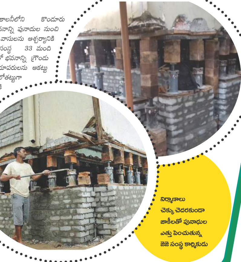
నిర్మాణాలు చెక్కు చెదరకుండా జాబితాలో ఉన్న భవనాలను ఎత్తు పెంచుతున్న జేజే సంస్థ కార్మికుడు